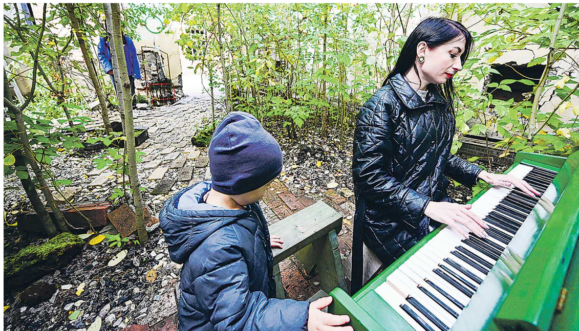
Согласно мастер-плану развития кластера предполагается, что люди смогут сами выбирать интересный им формат отдыха

Общая площадь территории кластера составит порядка 4 тысяч квадратных километров. Эти границы определены по итогам анализа территории, действующих туристических предложений и планов развития бизнеса и муниципальных образований. Все-