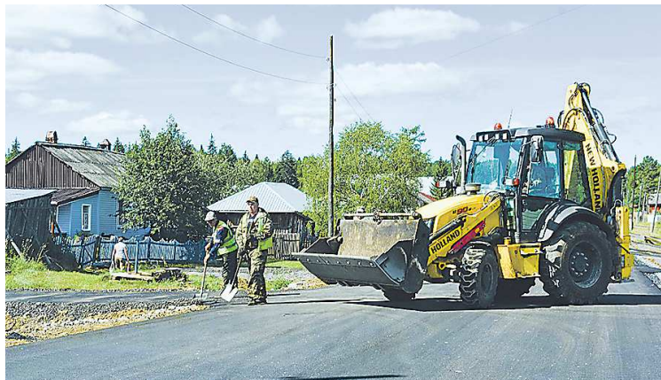
Ремонта дорог в поселках ждали давно

— Износ дорожного полотна в этих населенных пунктах очень высокий, но в бюджете в предыдущие годы закладыва-