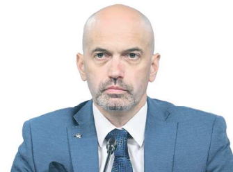
Азат КАДЫРОВ, первый заместитель министра спорта России

« Всё в этой жизни когда-то начинается и когда-то заканчивается. И наш праздник спорта тоже. Мы считаем, что он полностью удался по количеству участников, по количеству стран, по накалу борьбы на спортивных площадках, по организации. Большое спасибо правительству Свердловской области и губернатору Евгению Куйвашеву , мэру Екатеринбурга Алексею Орлову и всем, кто был задействован в проведении этого масштабного мероприятия.