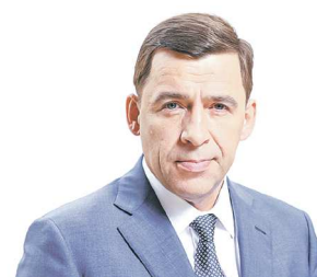
Евгений КУЙВАШЕВ, губернатор Свердловской области

« Всё в этой жизни когда-то начинается и когда-то заканчивается. И наш праздник спорта тоже. Мы считаем, что он полностью удался по количеству участников, по количеству стран, по накалу борьбы на спортивных площадках, по организации. Большое спасибо правительству Свердловской области и губернатору Евгению Куйвашеву , мэру Екатеринбурга Алексею Орлову и всем, кто был задействован в проведении этого масштабного мероприятия.