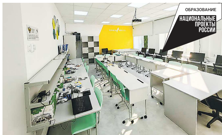
Кабинеты центра «Точка роста» оснащены по последнему слову техники

В ЗАТО Свободном завершился ремонт кабинетов центра образования естественно-научной и технологической направленностей «Точка роста». Он был создан на базе местной средней школы № 25 им. Героя Советского Союза генерал-лейтенанта Д.М. Карбышева.