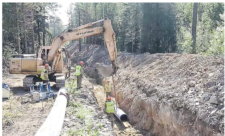
Замена водовода — один из крупнейших коммунальных проектов Кировграда

В Кировграде строят новый водовод от поселка Ежовского до городского Водоканала протяженностью почти 6,5 километра и пропускной способностью 13,3 тысячи кубометров воды в сутки. На масштабный проект из областного и местного бюджетов выделены 287 млн рублей.