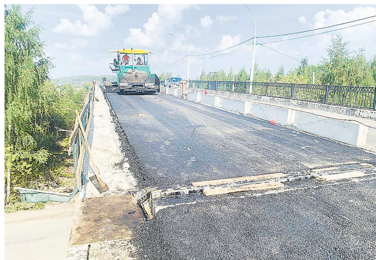
На отремонтированной полосе путепровода уложили новый асфальт

На подъездах к путепроводу были выставлены предупреждающие дорожные знаки, орга-