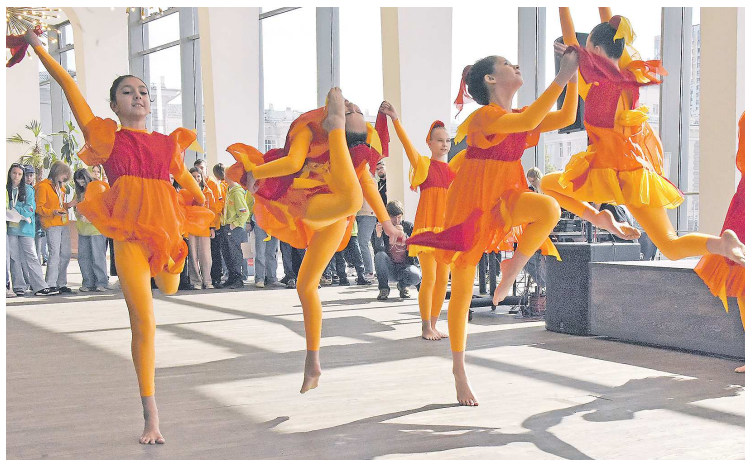
Для победителей «Большой перемены» в Екатеринбурге подготовили обширную культурную программу

– Ребята, я хочу, чтобы вы всегда оставались благодарны своим учителям и наставникам, ведь именно они вложили в вас все свои силы и знания, чтобы в каждом конкурсе, при решении каждой трудной задачи, ко-