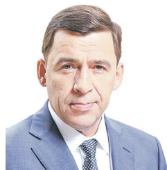
Губернатор Свердловской области Евгений КУЙВАШЕВ