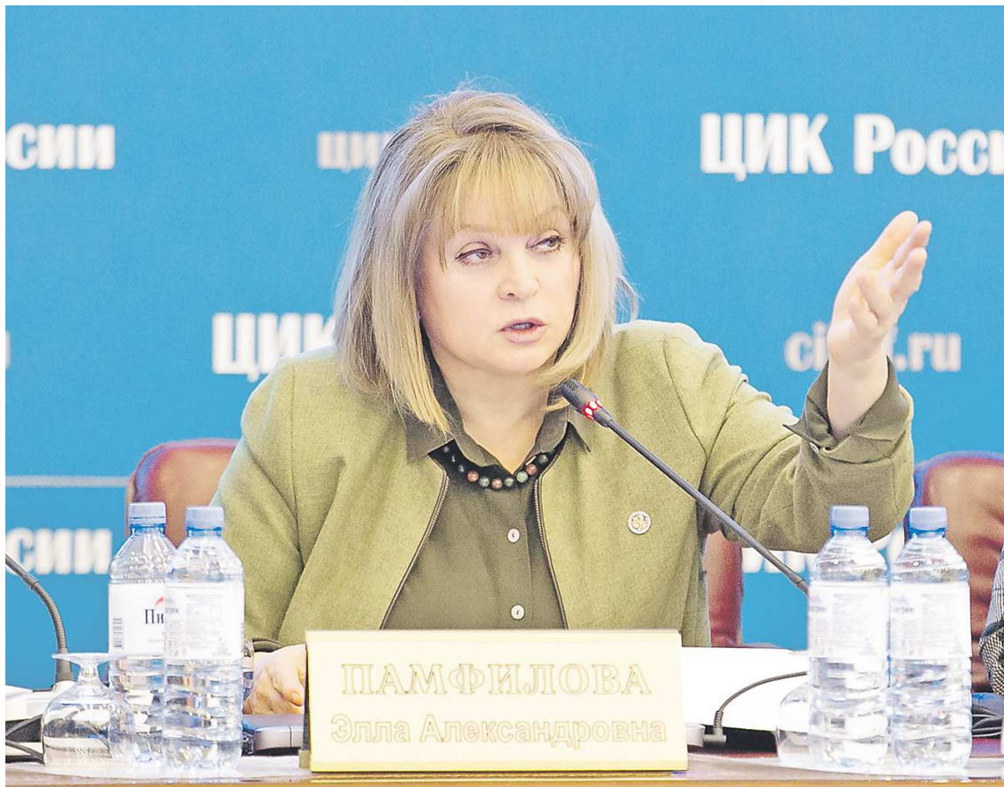
Элла Памфилова гарантирует тайну дистанционного электронного голосования

В ЦИК пояснили, что подобные конкурсы связаны с трудностями.