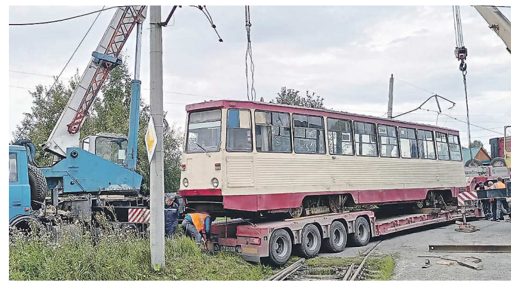
Челябинские трамваи доставили в Краснотурьинск утром 24 августа

До 2001 года линию обслуживал БАЗ, затем ее передали на баланс муниципалитета. С тех пор городские власти всеми силами стараются сохранить трамвайное движение, хотя это непросто: на территории – сильные пере-