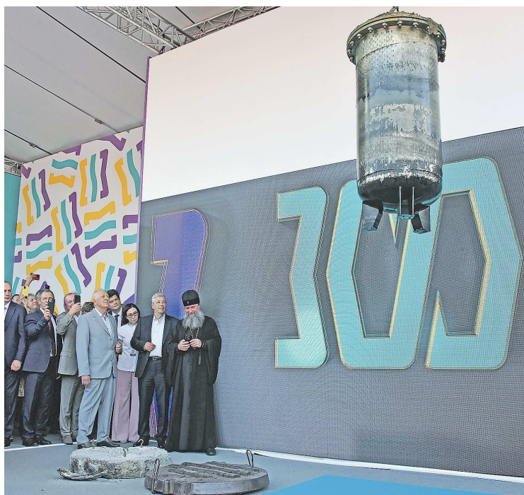
В «капсуле времени» ожидают найти послание для потомков, архивные фото, документы и видеозаписи, а изучением содержимого займутся специалисты Музея истории Екатеринбурга

Горожан в сквере собралось немало. Среди них те, кто присутствовал во время исторического события 50 лет назад.