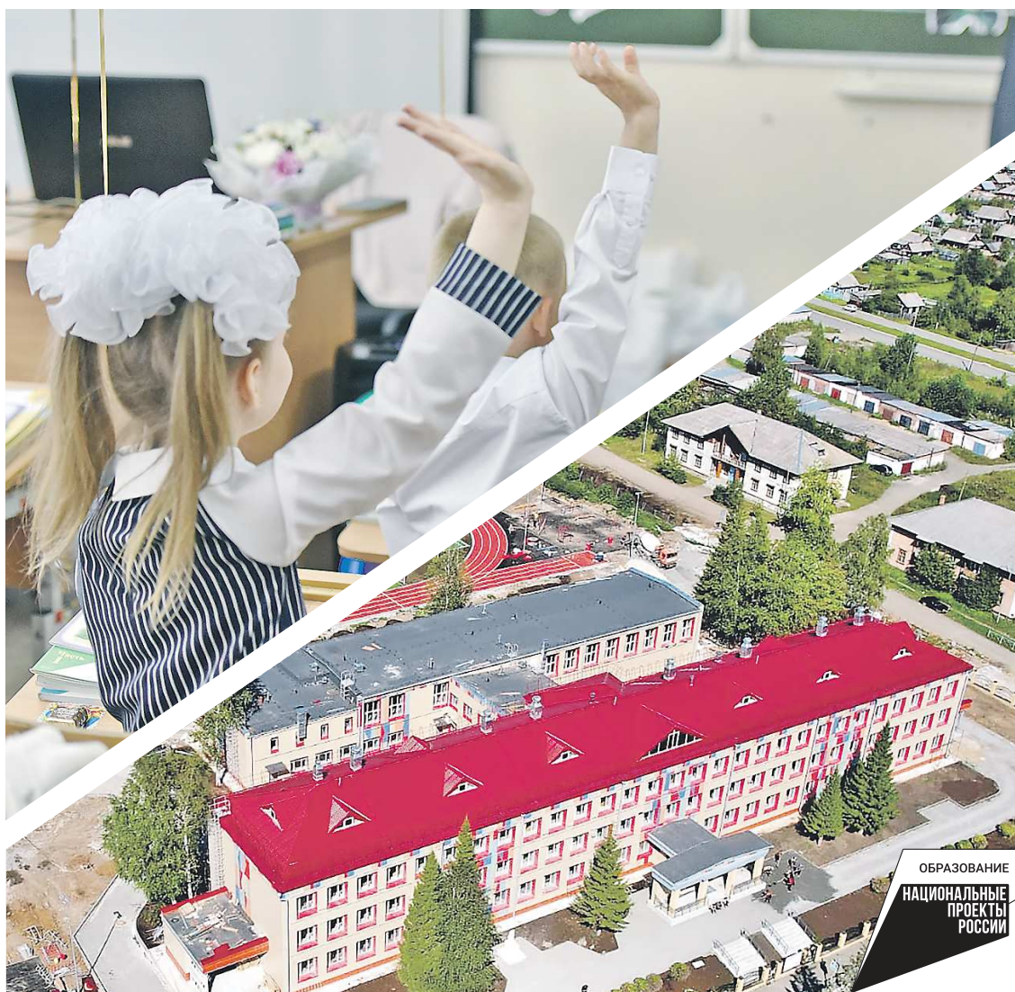
Руководство Свердловской области не только системно обновляет здания и инфраструктуру учебных заведений, но и активно внедряет образовательные новшества