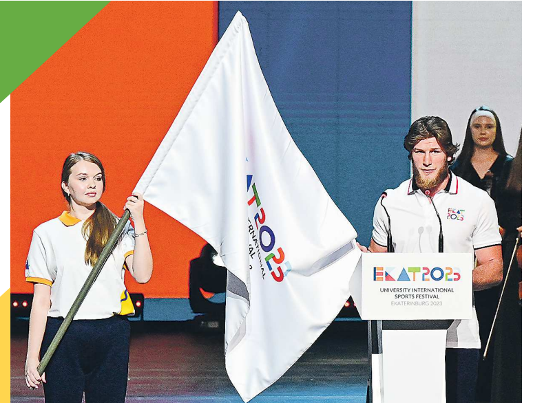
Когда Игорь Левитин зачитывал послание Владимира Путина, на экране транслировался перевод на другие языки