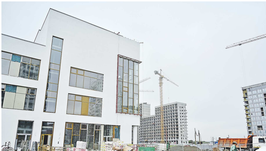
В образовательном центре кроме учебных классов разместится детский технопарк «Кванториум»

Губернатор Евгений Куйвашев защитил три заявки Свердловской области на предоставление инфраструктурных бюджетных кредитов. Самый большой из них – почти на 12 миллиардов рублей. Эти средства направлены на развитие инфраструктуры в пяти планировочных районах, в том числе чуть более трех миллиардов рублей – на строительство Губернаторского лицея в Солнечном. Он стоит несколько дороже, чем обычная школа, потому что он станет социально-куль-