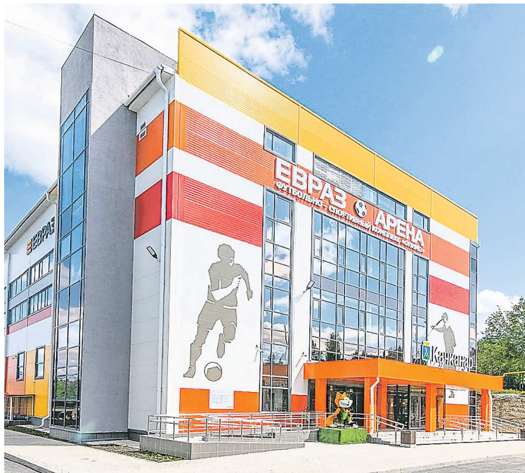
ЕВРАЗ Арена «Олимп» – спортивный объект для занятий футболом, баскетболом и волейболом, открытый в 2020 году

– Недавно в Качканар пустили скоростной электропоезд «Ласточка». На транспортную доступность муниципалитета, который располагается в 260 километрах от областного центра, это как-то повлияло?