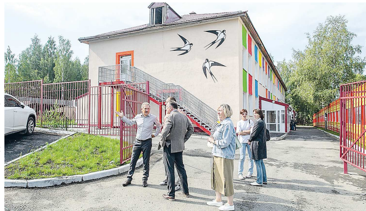
ПРЕСС-СЛУЖБА АДМИНИСТРАЦИИ КО

Что касается сферы образования, к новому учебному году проводятся текущие ремонты городских школ. На базе школы