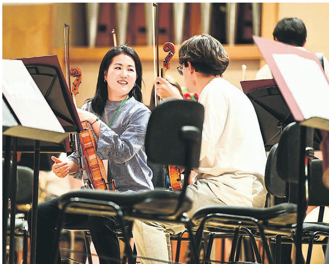
Первая репетиция участников IX Летней оркестровой академии в Свердловской филармонии

В Екатеринбурге начала работу IX Летняя оркестровая академия