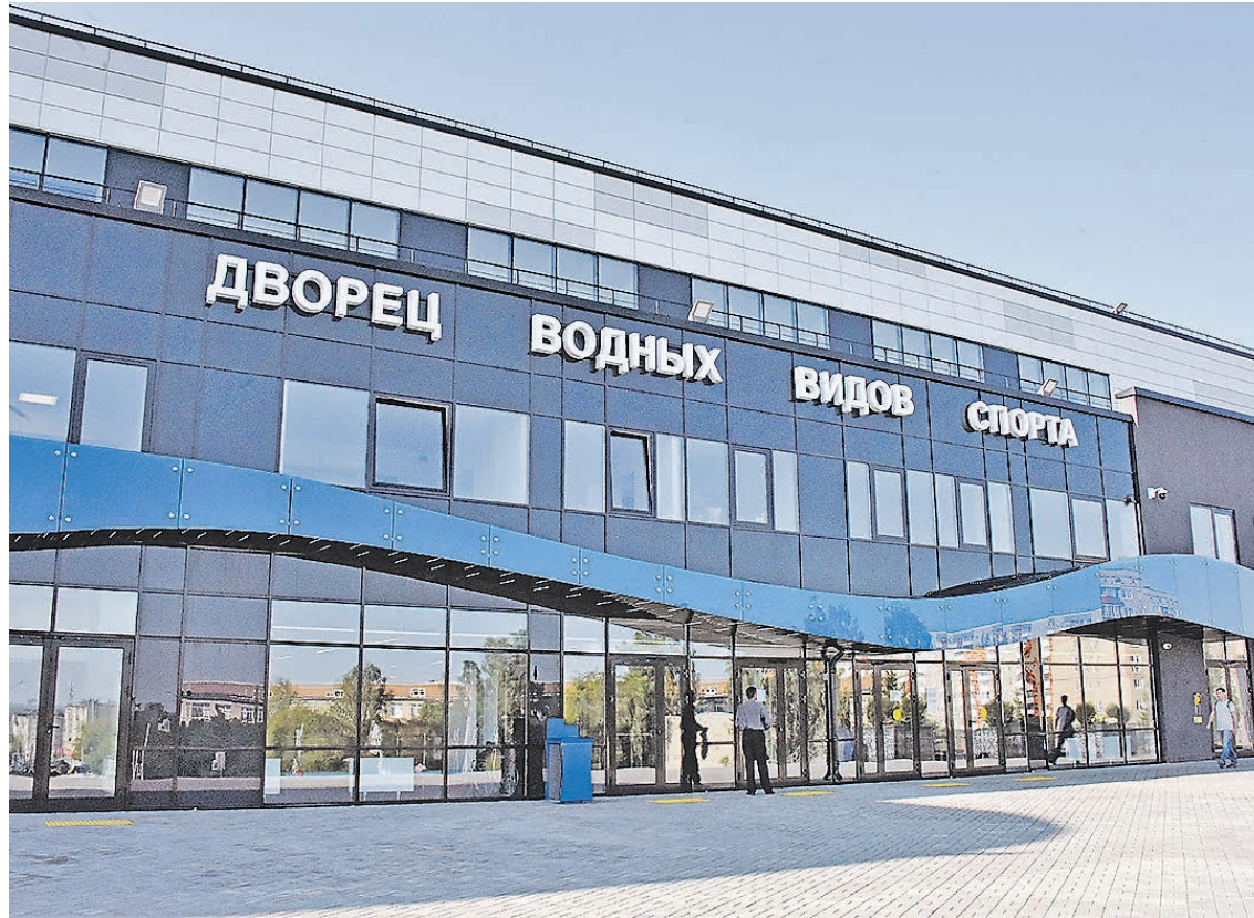
Под крышей обновленного дворца объединены два здания и сразу четыре бассейна

Преисполняемся гордости. Ведь их бассейн – это не просто бассейн, а главная часть, ни больше ни меньше, Центра олимпийской подготовки по водным видам спорта. Его значимость для Златоуста, да и всего Южного Урала, наверное, вполне можно сравнить со значимостью для