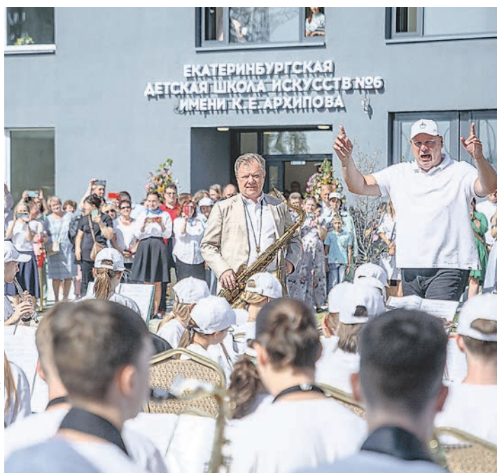
ПРЕСС-СЛУЖБА АДМИНИСТРАЦИИ ЕКАТЕРИНБУРГА

Саксофонист, народный артист России Игорь Бутман и заслуженный деятель искусств РФ, дирижер оркестра «Уралбэнд» Анатолий Павлов на открытии корпуса Екатеринбургской детской школы искусств № 6