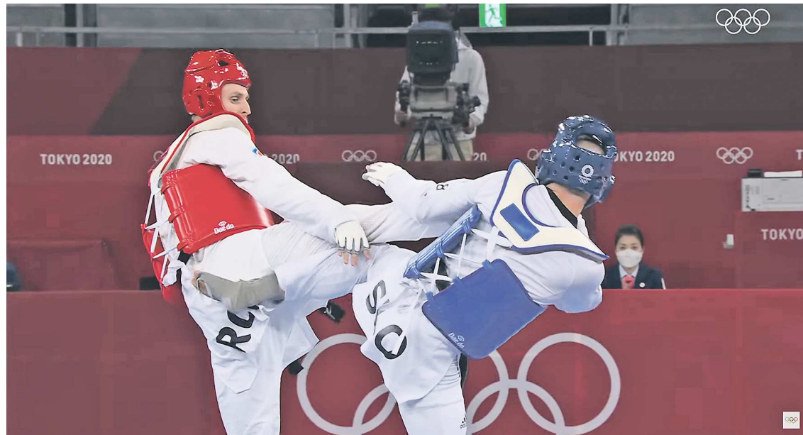
Владислав Ларин (слева) – один из двух российских олимпийских чемпионов по тхэквондо

СКРИНШОТ ТРАНСЛЯЦИИ ПОЕДИНКА ВЛАДИСЛАВА ЛАРИНА