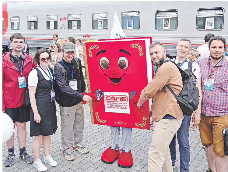
Участников фестиваля «Книжные маяки России» в необычной форме встретили в том числе представители Свердловской межрегиональной библиотеки