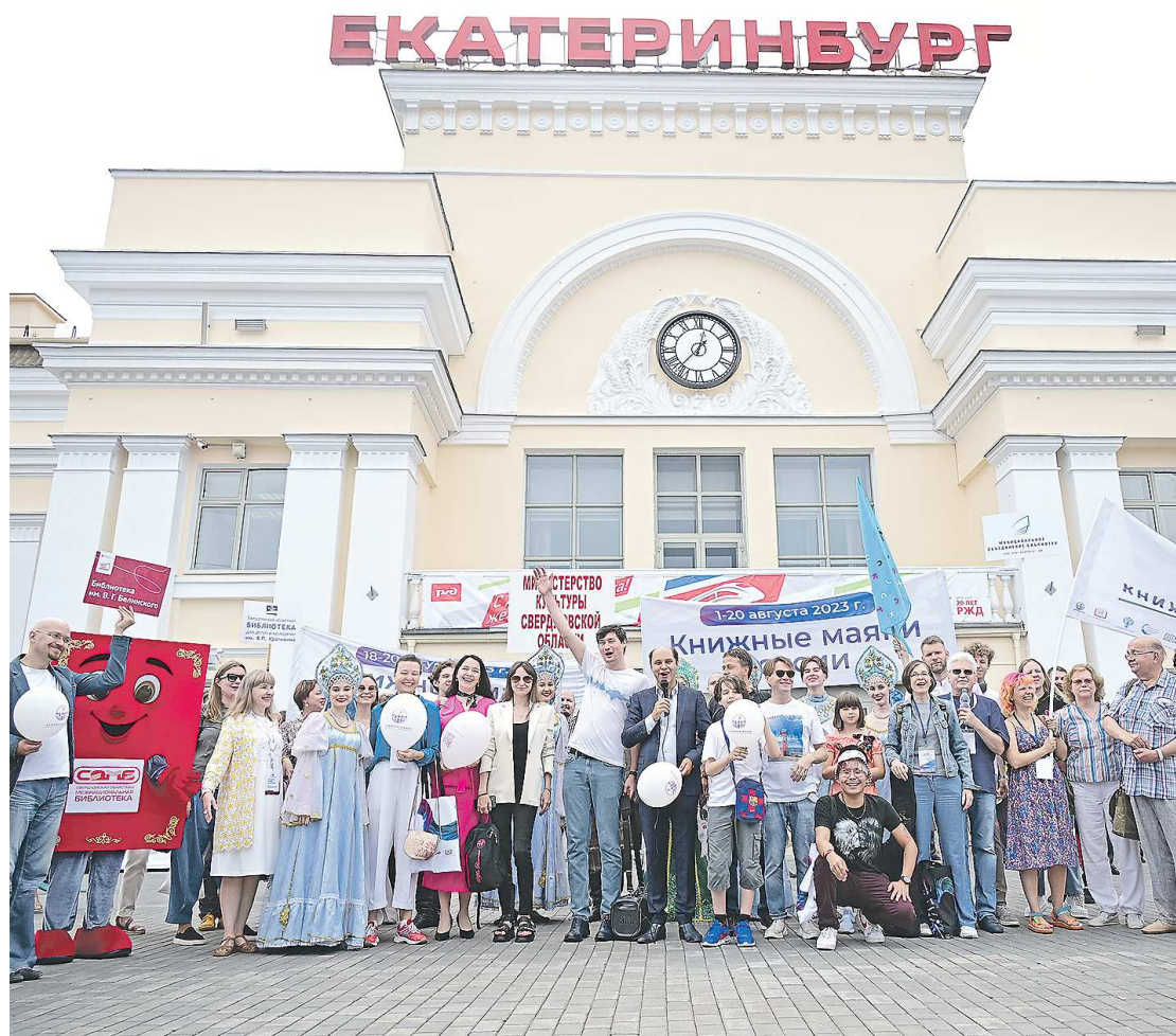
Участники фестиваля «Книжные маяки России» и встречающая их делегация на перроне железнодорожного вокзала