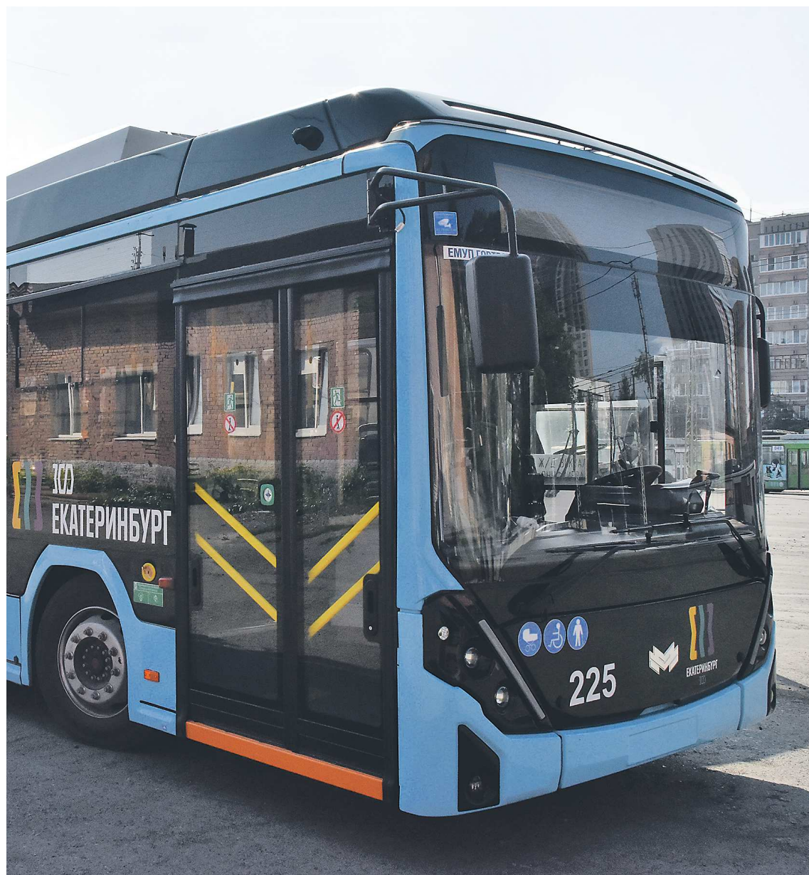
Троллейбусы по желанию горожан выкрашены в ярко-синий цвет, его выбрали на открытом голосовании

К пассажирам он доедет даже по тем улицам, где нет контактной сети