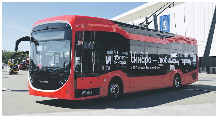
У современного троллейбуса увеличены площадь остекления и высота потолка

«Мы рады в честь 300-летия любимого города вручить Екатеринбургу наш подарок. Уверен, что горожане оценят комфорт и удобство передвижения в современном троллейбусе, и надеюсь, что он сможет стать