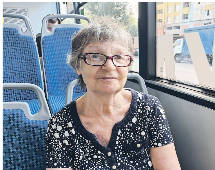
Пассажиры пока привыкают к новым троллейбусам, но в одном уже уверены: в них комфортнее, чем в старых.

В Екатеринбурге продолжается модернизация транспортной системы. Изменились номера нескольких троллейбусных маршрутов, и появился один новый маршрут, по которому ходят 11 новых недавно поступивших из Белоруссии машин. Как обновление троллейбусного парка изменило и продолжит менять жизнь екатеринбуржцев – узнали корреспонденты «Областной газеты» Борис ЯРКОВ и Максим НАЧИНОВ.