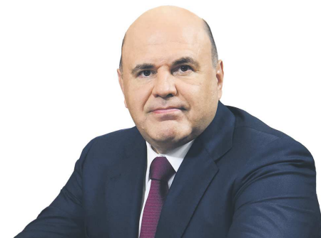
Михаил МИШУСТИН, премьер-министр РФ

“ Мы активно закупаем современные автобусы, троллейбусы, трамваи... Проект по обновлению городского электрического транспорта стал хорошим дополнением к нашей работе и с прошлого года уже реализуется в десяти российских субъектах. На него в течение ближайших трех лет направим порядка 100 миллиардов рублей.