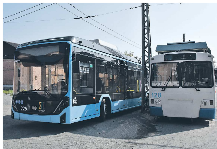
В отличие от старых моделей новый троллейбус может до 40 километров проехать без подключения к электросетям