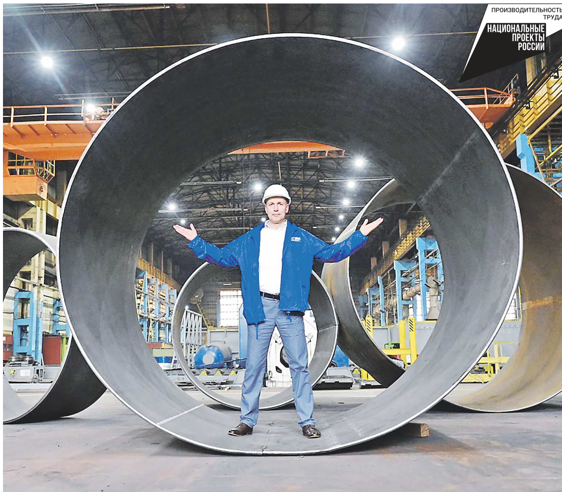
Областной министр инвестиций и развития Вадим Третьяков демонстрирует продукцию завода

– Сегодня у заказчиков повышенные требования – у изделий должна быть сложная огнеупорная защита. Мы такую продукцию делаем, но технология требует больше пространства и нового оборудования. В стране анонсированы крупные проекты по глубокой переработке нефти и газа, и все конструкции на этих предприятиях должны быть покрыты огнезащитными составами. После завершения работ по проекту мы сможем выпускать на 20-30 процентов больше та-