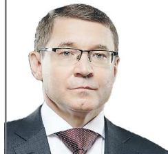
Полномочный представитель Президента России в Уральском федеральном округе

Уважаемые железнодорожники и ветераны отрасли! Благодарю вас за добросовестный труд, весомый вклад в социально-экономическое развитие региона. Желаю вам крепкого здоровья, успехов, благополучия, всего самого доброго!