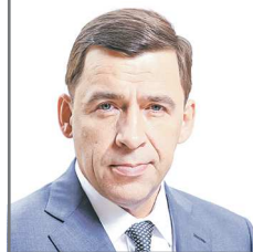
Губернатор Свердловской области Евгений КУЙВАШЕВ

Уважаемые работники и ветераны Свердловской железной дороги!