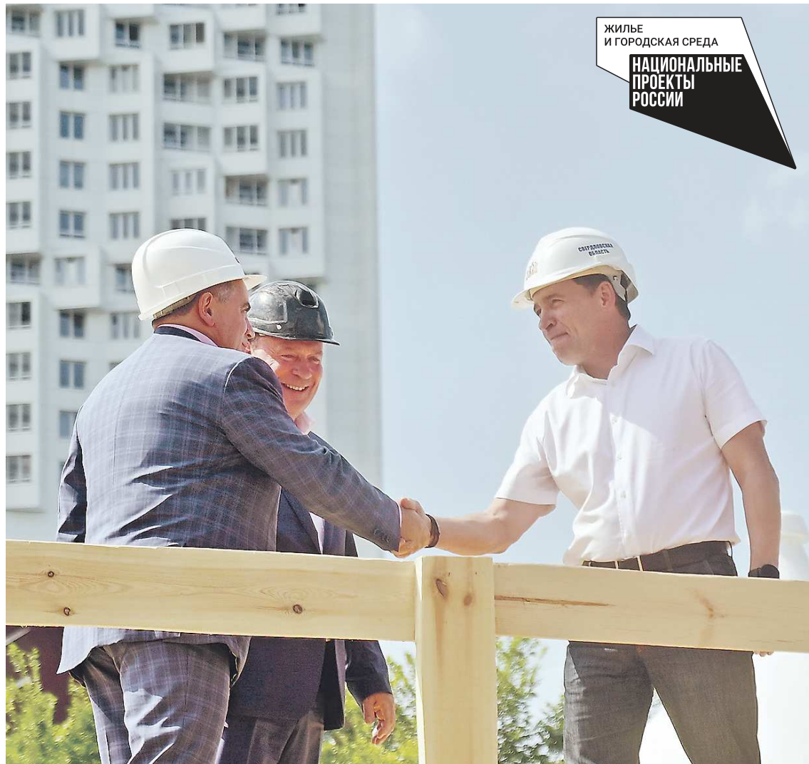
Евгений Куйвашев поблагодарил участников проекта и тех, благодаря кому он стал возможен

Евгений Куйвашев дал старт первому в регионе проекту комплексного развития территории нежилкой застройки