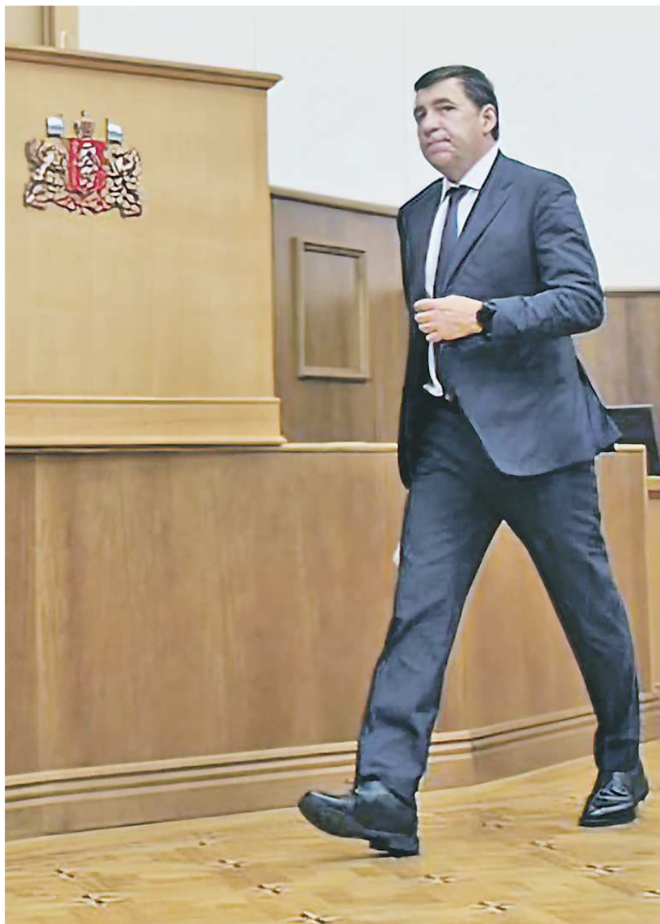
Евгений Куйвашев уверен в дальнейшем динамичном развитии Свердловской области

«В прошлом году оснащены 2 сосудистых центра и 15 первичных сосудистых отделений. Организован межрайонный центр по лечению хронической сердечной недостаточности в Тавдинской центральной больнице. Созданы 3 центра онкологической помощи: в Нижнем Тагиле, Серове и Красноуфимске. Высокотехнологичное оборудование получили Областная клиническая больница № 1 и свердловский онкодиспансер. Одна из наших главных задач – улучшение работы первичного звена. В 2022 году созданы 27 новых фельдшерско-акушерских пунктов и 2 отделения общей врачебной практики. Завершен ремонт 56 объектов здравоохранения. Приобретены 162 автомобиля. Общее финансирование программы составило 3,6 миллиарда рублей. Но главное в медицине – это, конечно, кадры. Для насыщения системы здравоохранения квалифицированными специалистами реализуется полный цикл подготовки медиков – от ранней профориентации в школах до целевого обучения в медицинских колледжах и вузах. Так, сейчас в Уральском государственном медицинском универси-