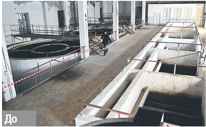
Старая станция, построенная в 1950-е, скорее всего, будет снесена

Жители городского округа Первоуральск – более 145 тысяч человек – черпают воду из двух источников: наземного – Верхне-Шайтанского пруда и подземного – скважин в Нижнесергинском районе. Ежедневно муниципалитет потребляет 52 тысячи кубометров воды, половина этого объема приходится на водоем, половина – на скважины. Как рассказали «ОГ» в МУП «Водоканал», вода из скважин благодаря их большой глубине поступает достаточно чистой. А вот качество воды из пруда оставляет желать лучшего. На него негативно влияет целый ряд факторов: погодные условия, эко-