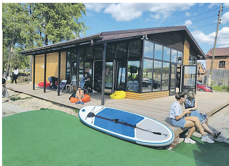
Подобный туристско-информационный центр до конца года должен появиться в Верхних Таволгах

Результаты первого отбора были объявлены в июне. Сообщалось, что гранты распределили на создание 20 модульных конструкций, в новых кемпингах и глемпингах появятся свыше 100 новых мест для туристов. Также будут обустроены 13 пляжей, созданы шесть круглогодичных плавательных бассейнов, промаркированы четыре новых туристских маршрута, созданы три электронных путеводителя.