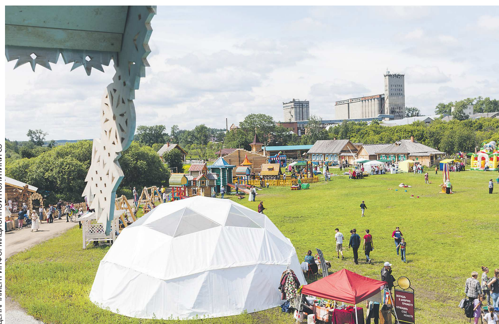
В арамилевском «Парке Сказов» благодаря гранту будут созданы дополнительные условия для людей с ограниченными возможностями здоровья