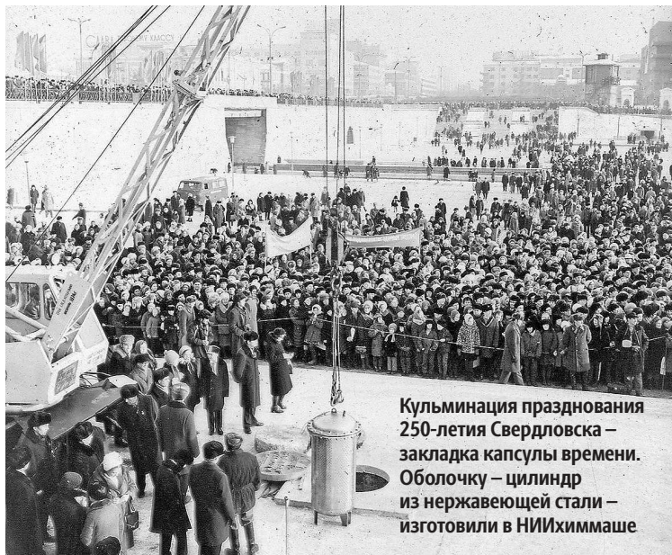
Кульминация празднования 250-летия Свердловска – закладка капсулы времени. Оболочку – цилиндр из нержавеющей стали – изготовили в НИИХиммаше

Одно из фото на выставке сделано в 1923 году, когда Екатеринбург отмечал 200-летие. На нем запечатлена юбилейная комиссия. Мероприятия планировали приурочить как раз к 15 июля, Дню освобождения Урала от Колчака , но, «в силу тяжелого материального положения» установили официальным днем празднования 1 августа. Так вот подготовкой всех