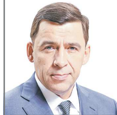
Губернатор Свердловской области Евгений КУЙВАШЕВ