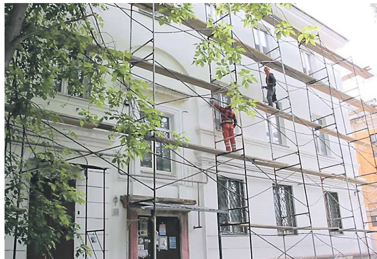
После капремонта дома приобретают совершенно иной вид, отмечают жители