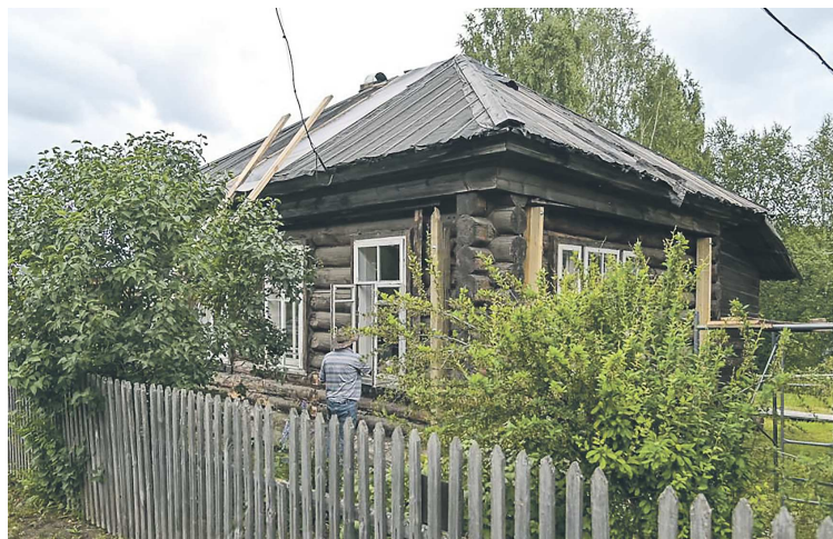
Дом-школа, где учился Мамин-Сибиряк, обретет вторую жизнь

В поселке Висим под Нижним Тагилом восстанавливают объект культурного наследия федерального значения