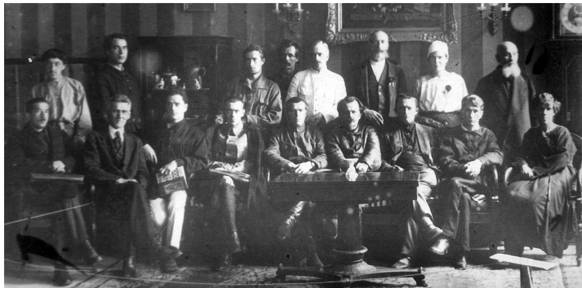
Юбилейная комиссия, готовившая праздник к 200-летию города

В Музее истории Екатеринбурга к 300-летию города обновлены центральные выставочные залы