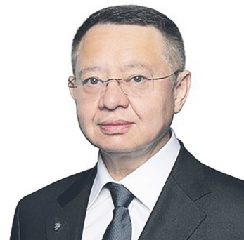
Ирек ФАЙЗУЛЛИН, министр строительства и жилищно- коммунального хозяйства РФ

“ Механизмы капремонта многоквартирных домов будут совершенствоваться. Минстрой уже работает над созданием единой системы государственного учета жилищного фонда. Она основывается на базе электронных паспортов домов в ГИС ЖКХ, вносится в нее будет информация о текущем и капитальном ремонте, техническом состоянии отдельных элементов и всего здания в целом. Результатом этой работы станет более прозрачное и эффективное планирование программ капремонта в регионах. Будут исключены случаи проведения капремонта в домах, которые необходимо сносить.