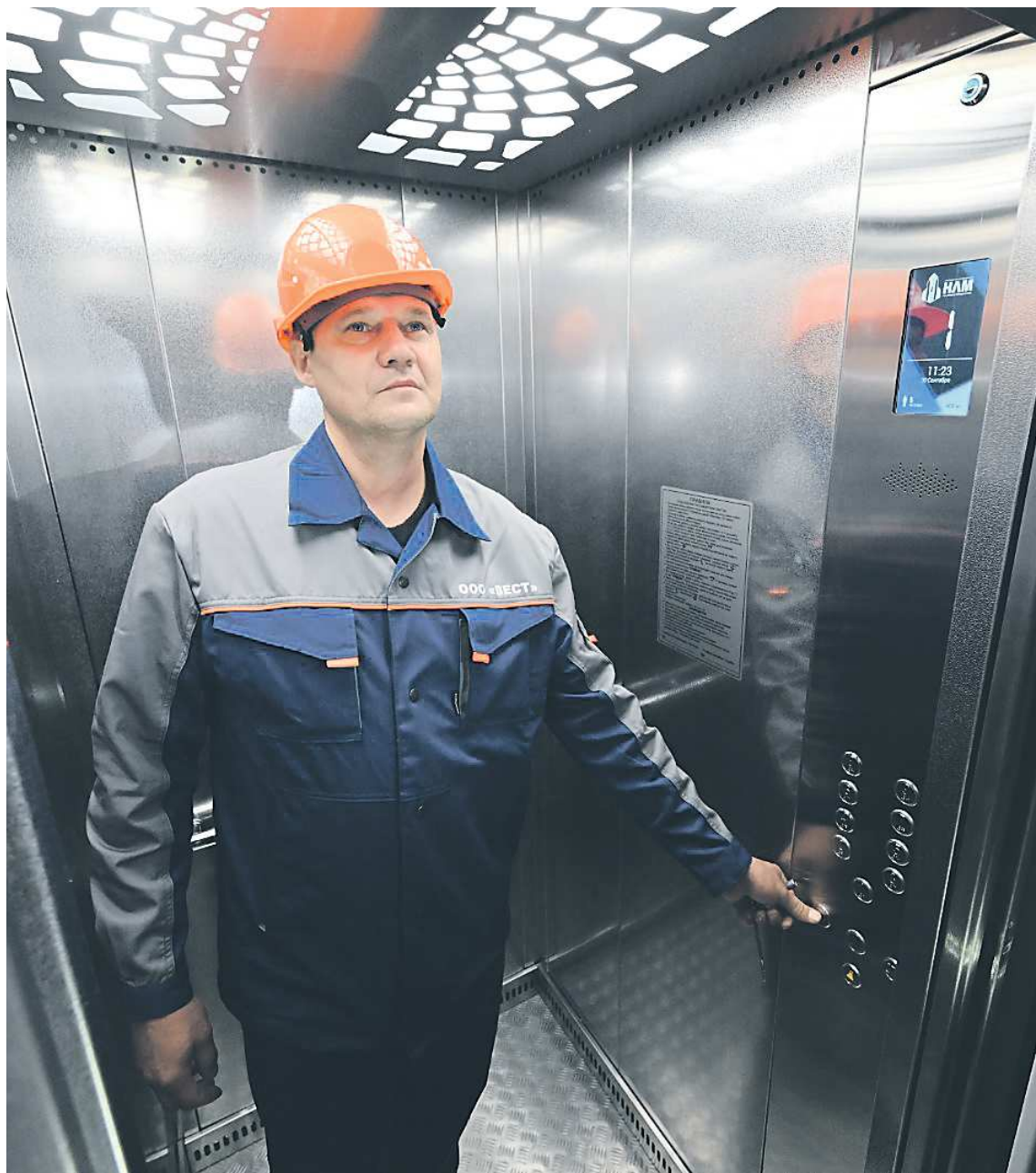
Двери в новых лифтах закрываются почти бесшумно, при установке их неоднократно тестируют