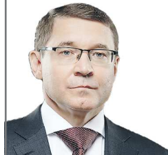
Полномочный представитель Президента России в Уральском федеральном округе

Желаю вам и вашим близким крепкого здоровья, счастья, благополучия, всего самого доброго!