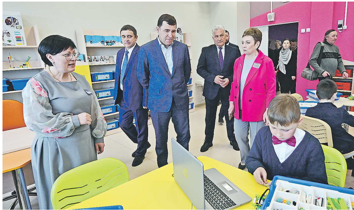
Самые современные условия для получения образования должны быть обеспечены как в крупных городах, так и в отдаленных населенных пунктах, считает глава региона

Образование Наука и университеты Малое и среднее предпринимательство Экология