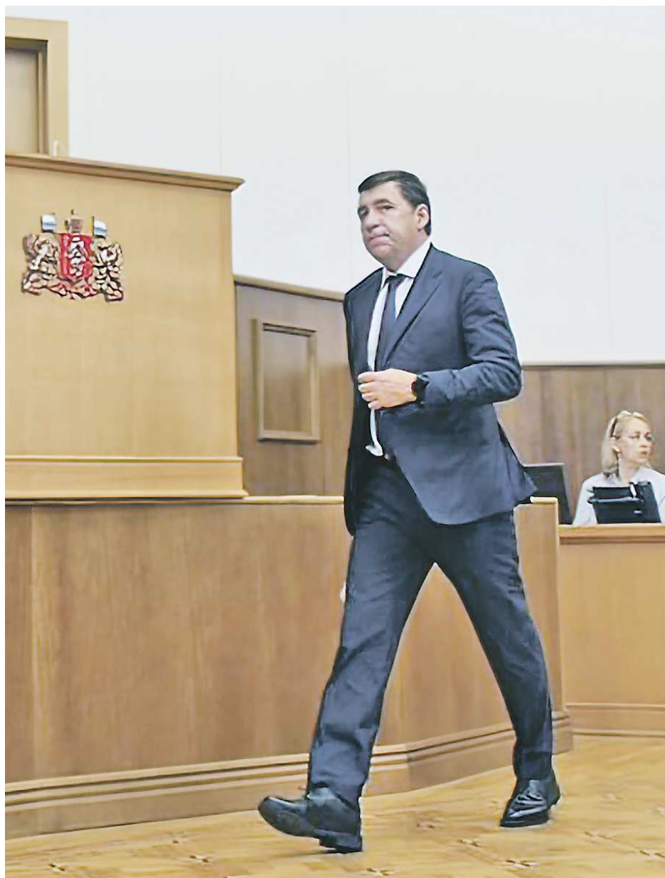
Евгений Куйвашев уверен в дальнейшем динамичном развитии Свердловской области

«В прошлом году оснащены 2 сосудистых центра и 15 первичных сосудистых отделений. Организован межрайонный центр по лечению хронической сердечной недостаточности в Тавдинской центральной больнице. Созданы 3 центра онкологической помощи: в Нижнем Тагиле, Серове и Красноуфимске. Высокотехнологичное оборудование получили Областная клиническая больница №