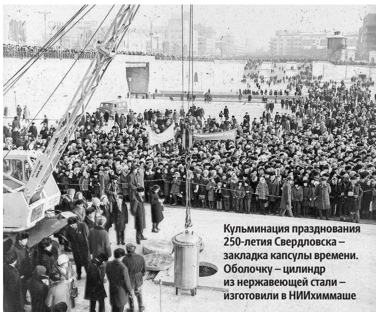
Кульминация празднования 250-летия Свердловска – закладка капсулы времени. Оболочку – цилиндр из нержавеющей стали – изготовили в НИИХиммаше

Одно из фото на выставке сделано в 1923 году, когда Екатеринбург отмечал 200-летие. На нем запечатлена юбилейная комиссия. Мероприятия планировали приурочить как раз к 15 июля, Дню освобождения Урала от Колчака, но, «в силу тяжелого материального положения» установили официальным днем празднования 1 августа. Так вот подготовкой всех