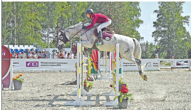
Состязания собрали более 250 сильнейших всадников из 14 регионов России и из-за рубежа