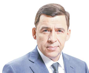
Евгений КУЙВАШЕВ, губернатор Свердловской области

На сессии форума «Спорт: мост дружбы России и Африки»