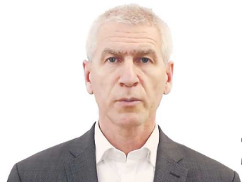
Олег МАТЫЦИН, министр спорта РФ

“ В сентябре 2024 года Россия проведет Всемирные игры дружбы. Соревнования пройдут в Москве и Екатеринбурге. Планируем проводить эти Игры раз в четыре года. Главная задача – развивать спорт, дать возможность соревноваться как можно больше. Россия остается верна принципам спорта вне политики, чистого спорта.