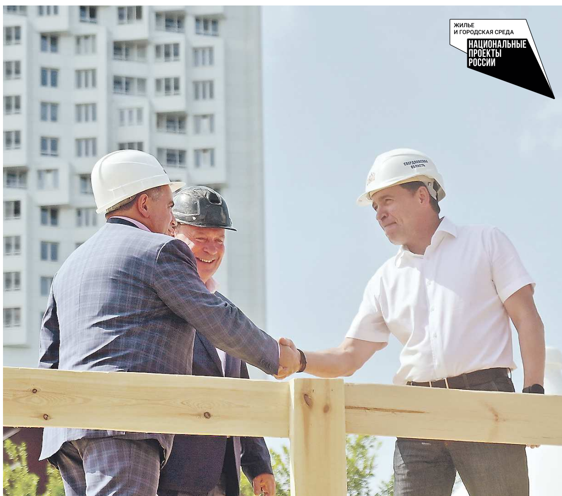
Евгений Куйвашев поблагодарил участников проекта и тех, благодаря кому он стал возможен

ЖИЛЬЕ И ГОРОДСКАЯ СРЕДА НАЦИОНАЛЬНЫЕ ПРОЕКТЫ РОССИИ