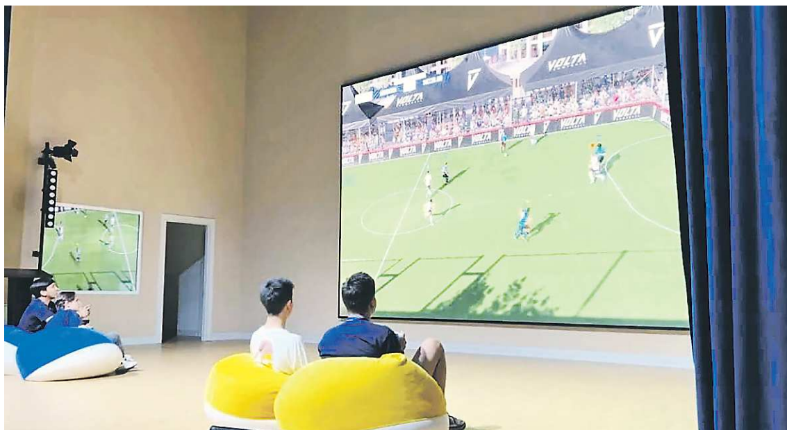
На первом этапе спортсмены соревнуются в онлайн-играх, после чего уже выходят на настоящий стадион

Теперь подростки могут играть в любимые компьютерные игры, но при этом не забывать о физическом спорте. Официально на турнирах участвовать можно с 16 лет, а это как раз тот самый возраст, когда работа в команде очень важна для становления личности. Хотя организаторы могут де-