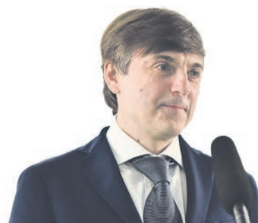
Сергей Кравцов министр просвещения РФ

На Всероссийском фестивале профессиональной ориентации школьников «Билет в будущее» в Екатеринбурге