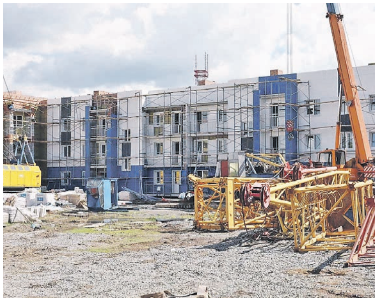
Совсем скоро в таких домах отпразднуют новоселье пострадавшие от пожара

– В квартирах пластиковые окна, отделка стен, натяжные потолки, на полу линолеум. Сделаны санузлы – раковины, ванны, унитазы. Квартиры разной планировки, по ме-