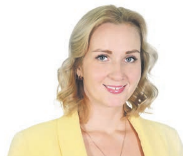
Мария Львова- Белова Уполномоченный при Президенте по правам ребенка

“Трудоустройство подростков выгодно всем: государству – как профилактика негативных проявлений и родителям, которые не будут переживать, чем их ребенок занимается в свободное время, но также и самим подросткам.