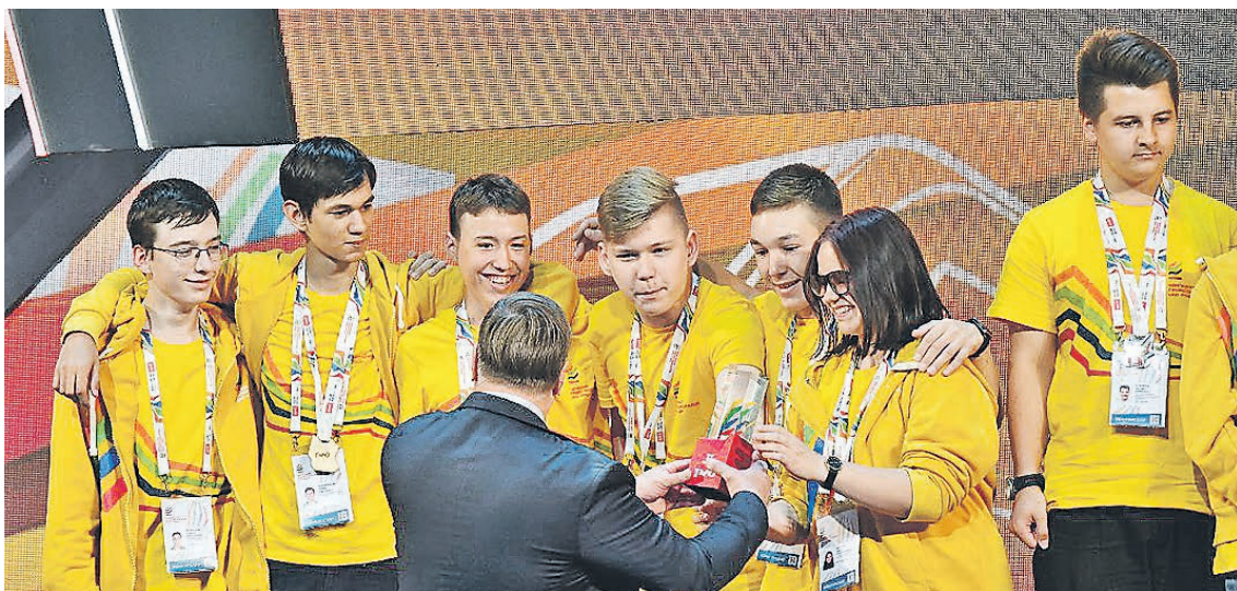
Команда Свердловской железной дороги по итогам командного этапа чемпионата юниоров стала второй

В столице Урала определили лучших юных профессионалов РЖД