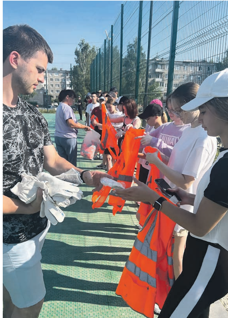
Перед началом трудового дня в «Серовавтодоре» – раздача рабочей одежды и инструктаж, а затем – полив цветов, прополка клумб

На собственном опыте школьники могут оценить плюсы официального трудоустройства через центры занятости или молодежные биржи труда. Это дает гарантию, что их права не будут нарушены, их не обманут. И слова о заботе государства о детях наполняются реальным смыслом. Ведь заработок подростков складывается из оклада, пропорционально отработанному времени, и материальной поддержки от службы занятости. К примеру, в Екатеринбурге, как сообщили в администрации города, трудотрядовцы при четырехчасовом рабочем дне получают в месяц более 11 тысяч рублей, при двухчасовом – более 7 тысяч.