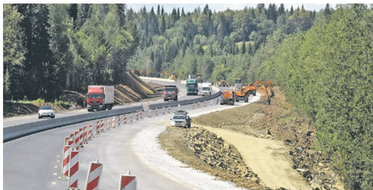
Люди и техника работают на трассе круглосуточно

Уралуправтодор ведет капитальный ремонт Пермского тракта с 2022 года. Вся дорога должна стать четырехполосной с разделением встречных потоков. Это необходимо для того, чтобы Р-242 могла принять дополнительный трафик, который придет со скоростной магистрали М-12. Отметим, что скоростная дорога будет интегрирована в масштабный логистический