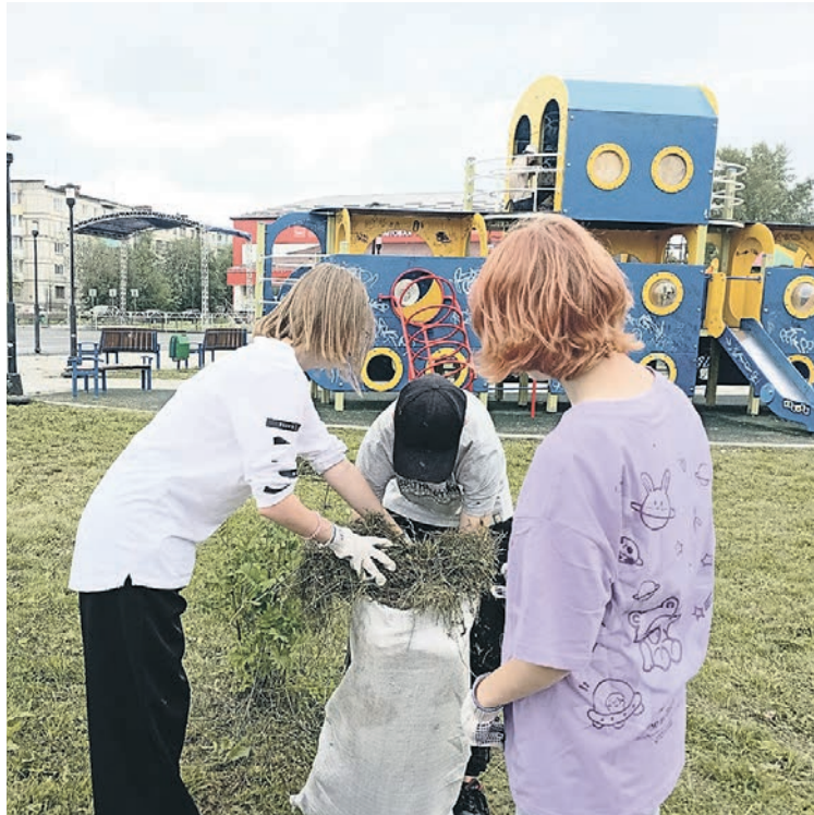
Уборку старой травы с газонов и детских площадок в Красноуральске доверили школьникам