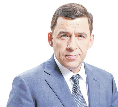
Евгений КУЙВАШЕВ, губернатор Свердловской области

Из обращения к участникам заседания по управлению лесным хозяйством в рамках климатического саммита ООН