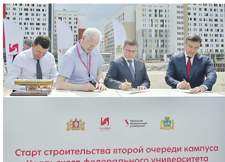
Участники церемонии поместили в капсулу времени пожелания студентам УрФУ и строителям. Она будет храниться в общественном центре кампуса до ноября 2025 года

Выходим с пустыря. Голую землю сменяют плитка и гладкий тротуар. Уже построенные объекты кампуса освещает яркое летнее солнце. Менее чем через два года оно будет также освещать здания Центра цифровой трансформации. А вид из окон общежитий станет наконец живописным.