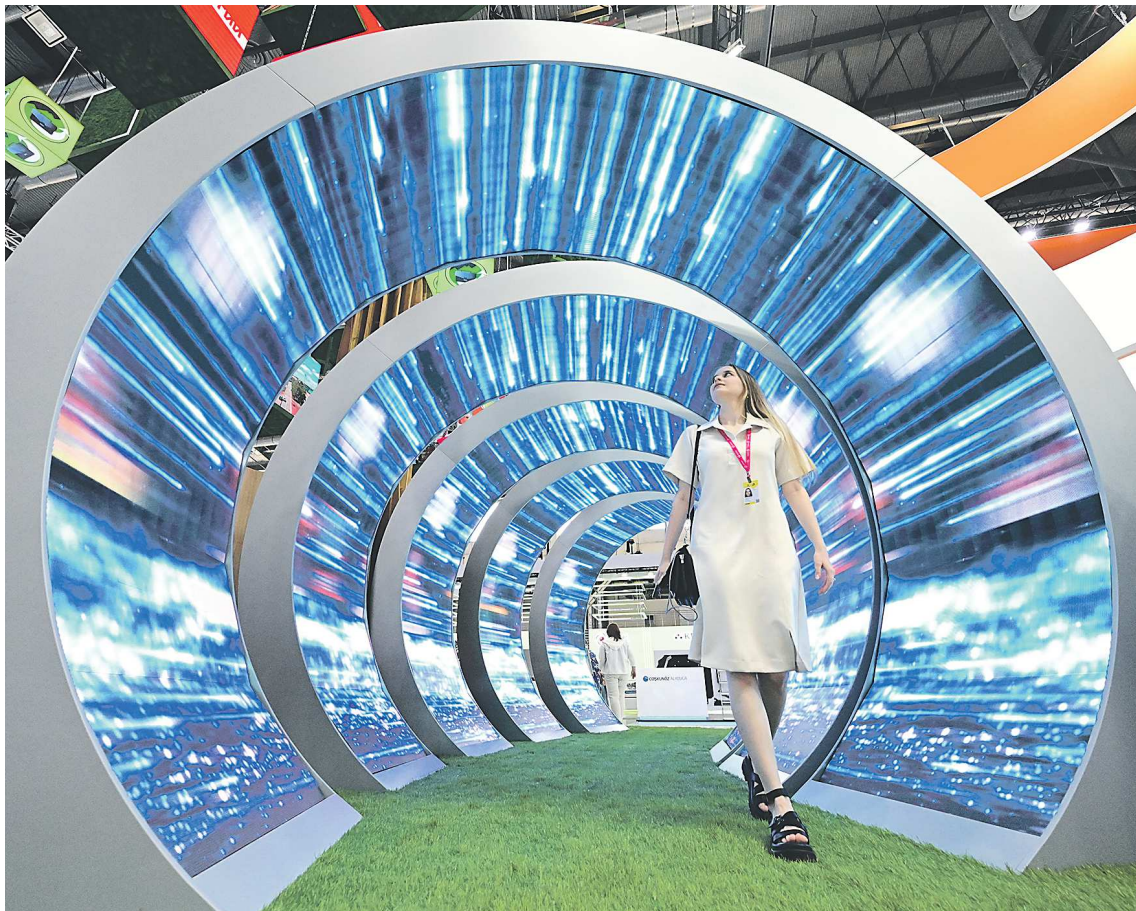
Большой цифровой тоннель на стенде ТМК символизирует трубу