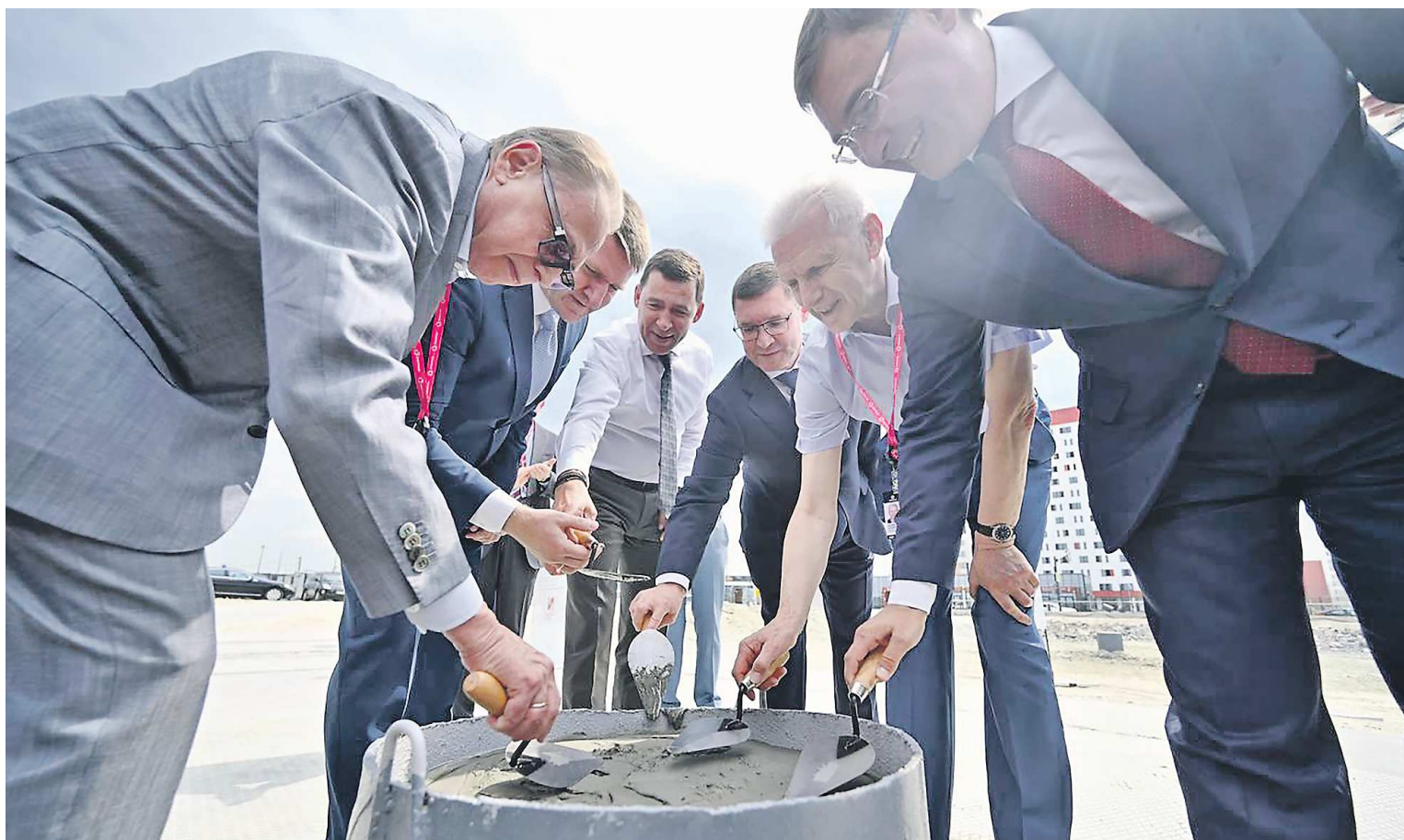
Участники церемонии заложили монеты с гравировкой «Екатеринбург – город трудовой доблести» в сваю – основание фундамента Института радиоэлектроники и информационных технологий УрФУ

Участники церемонии вооружаются мастерками и подходят к основанию бу-