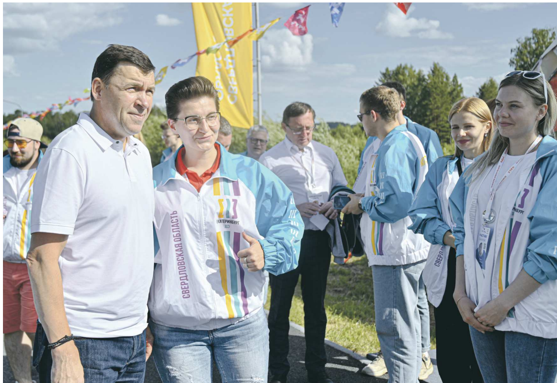
Евгений Куйвашев и участники свердловской делегации активно общались не только на официальной площадке форума, но и за ее пределами

Губернатор рассказал, что «Кампус» подразумевает стипендиальную программу, которая пока касается только отличников, обучающихся по приоритетным для региона специ-