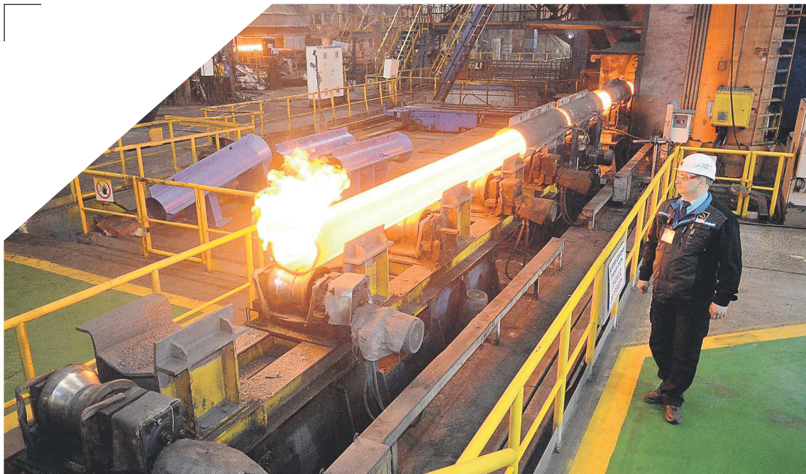
ПАВЕЛ ВОРОЖЦОВ / ГАЛИНА СОЛОВЬЕВА