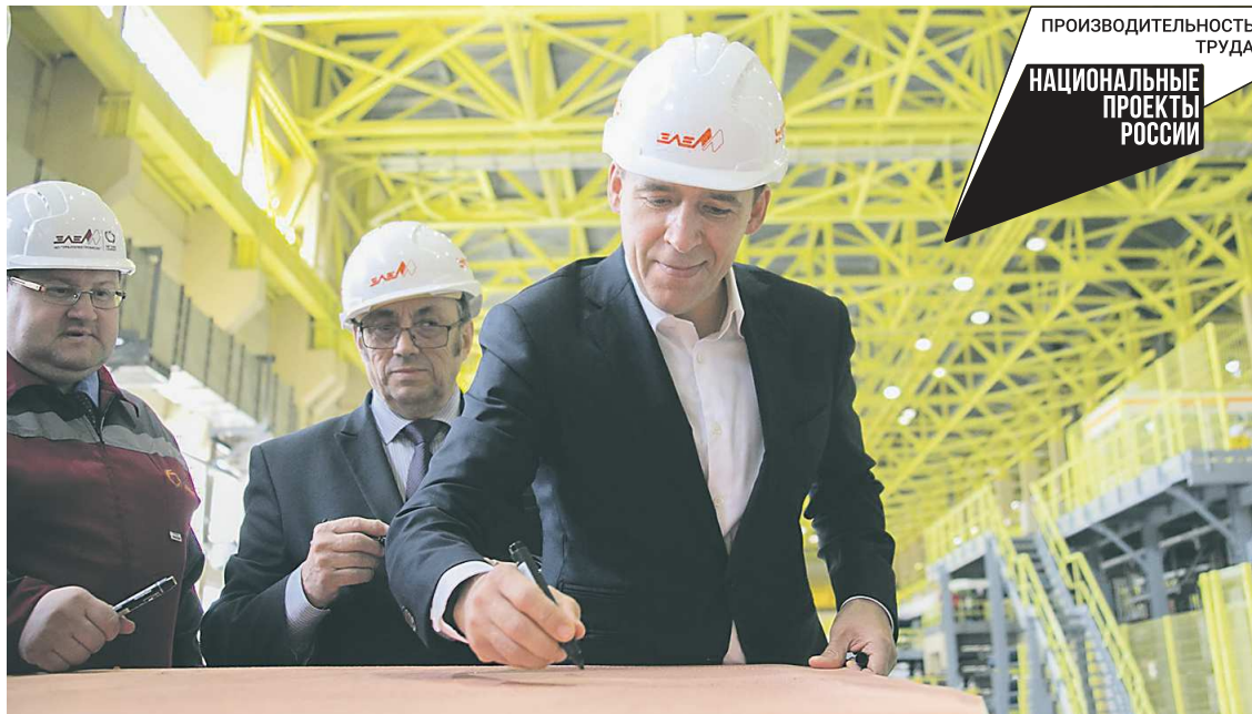
Свердловская область, благодаря поддержке Евгения Куйвашева , включилась в реализацию нацпроекта «Производительность труда» одной из первых, в 2019 году

Всего сегодня в регионе более 200 предприятий с выручкой ме-