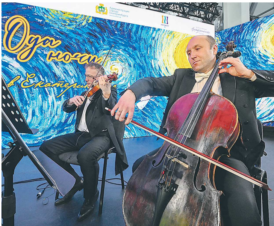
Площадки «Безумных дней» специально расположены в пешей доступности друг от друга. Самая большая сцена фестиваля развернется в Саду Вайнера, где уже идет монтаж зала под открытым небом на 1,6 тысячи мест

– Если говорить о географии фестиваля, то у нас выступают музыканты из 9 городов России – Москва, Санкт-Петербург, Белгород, Новосибирск, Омск, Уфа, Пермь и, конечно, Екатеринбург. На протяжении нескольких лет на этом фестивале мы больше ориентирова-