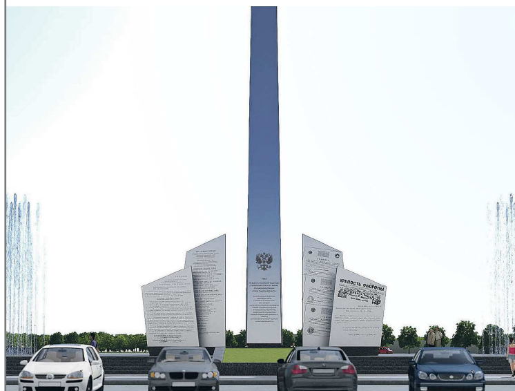
ПРЕСС-СЛУЖБА АДМИНИСТРАЦИИ КАМЕНСКА-УРАЛЬСКОГО

На минувшей неделе на центральной площади города рядом с мэрией строители начали демонтировать бетонные плиты, гранитную облицовку парапетов и фонтан «Одуванчик». На этом месте за три месяца они должны установить 26-метровую стелу.