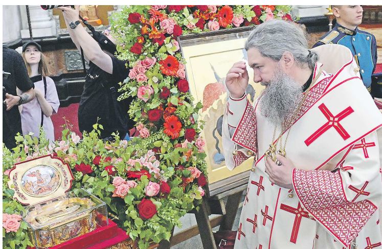
Великомученик Георгий Победоносец является символом победы над злом

Сотни екатеринбуржцев и гостей уральской столицы смогли поклониться в этот день одной из главных православных святынь – частицам мощей Георгия Победоносца. Среди них были военнослужащие, сотрудники органов безопасности, силовых ведомств,