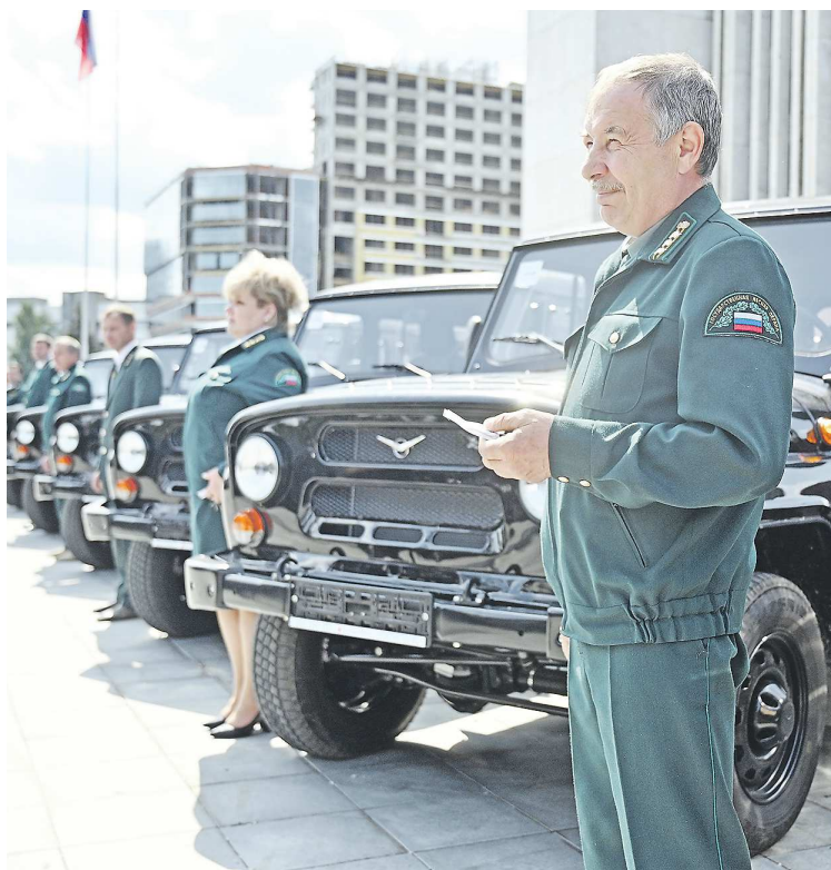
На закупку внедорожников из федерального бюджета было выделено более 27 млн рублей

– Внедорожники повысят мобильность лесных инспекторов, лесной охраны, они позволят более качественно осуществлять работу как в повсед-