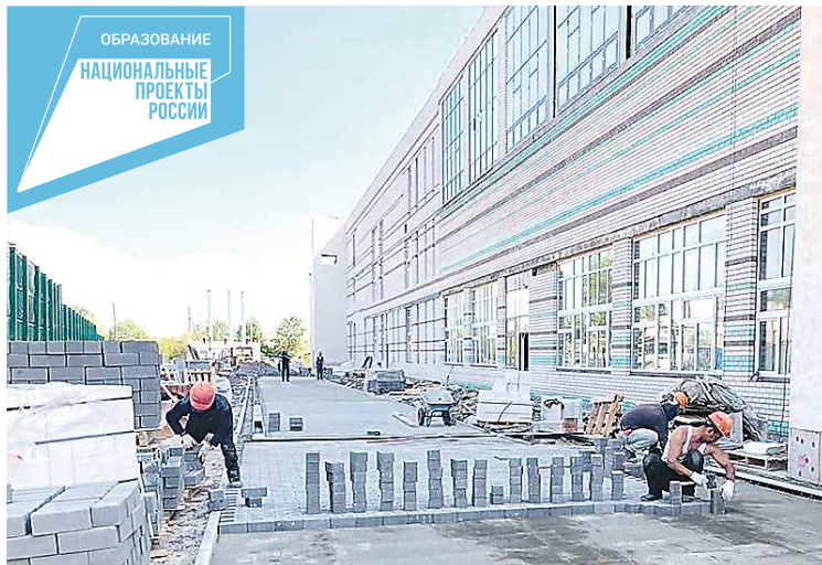
В Серове территорию вокруг построенной школы замостят тротуарной плиткой

В Серове трехэтажная коробка здания уже выстроена. Это образовательное учреждение станет одним из крупнейших на севере региона. В школе предусмотрены более 50 учебных