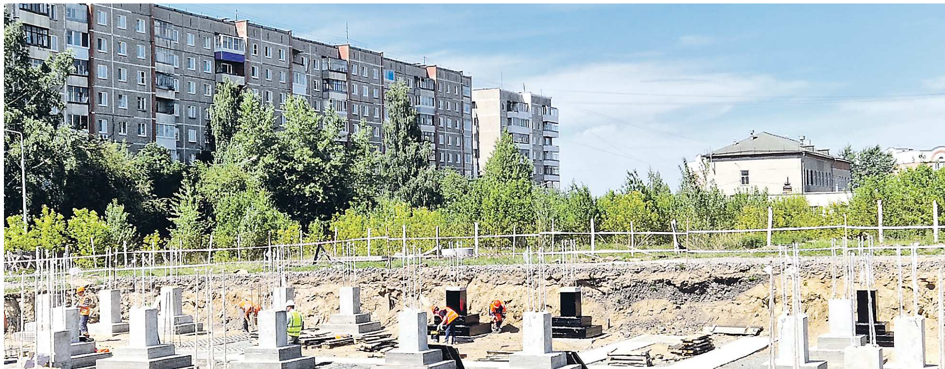
Закладка фундамента под новый культурно-образовательный центр на Гальянке