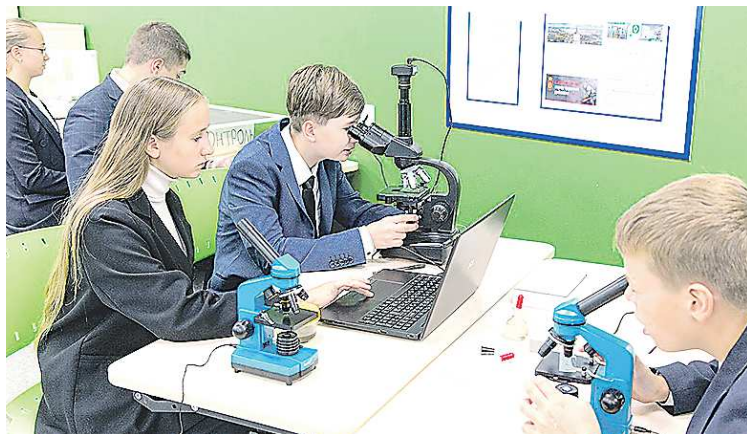
Одно из мероприятий кванториума – конкурс творческих проектов

Как рассказали «ОГ» в гимназии, в новом технопарке регулярно