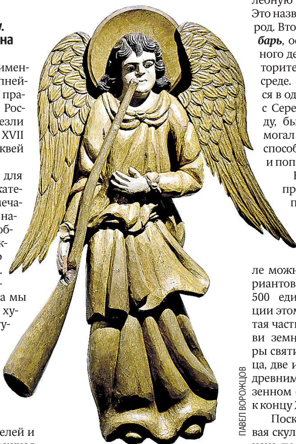
Больше фото и материалов на нашем сайте

И это еще один знаковый момент для свердловчан, которые придут на выставку.