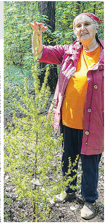
ДЕПАРТАМЕНТ ИНФОРМАЦИОННОЙ ПОЛИТИКИ СВЕРДЛОВСКОЙ ОБЛАСТИ