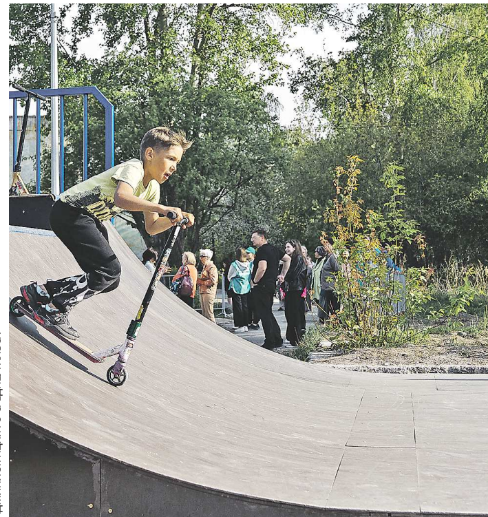
АДМИНИСТРАЦИЯ ГО СРЕДНЕУРАЛЬСЬКА

Долгожданный для молодежи объект открылся на днях на базе Центра патриотического воспитания.