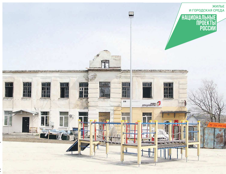
В этом здании после ремонта разместятся несколько учреждений, включая филиал колледжа

Когда градообразующее предприятие обанкротилось, часть специальностей оказалась невостребована, и большие площади тоже стали не нужны. Филиал переехал в здание средней школы. В нем проводят обучение по специальностям «техно-