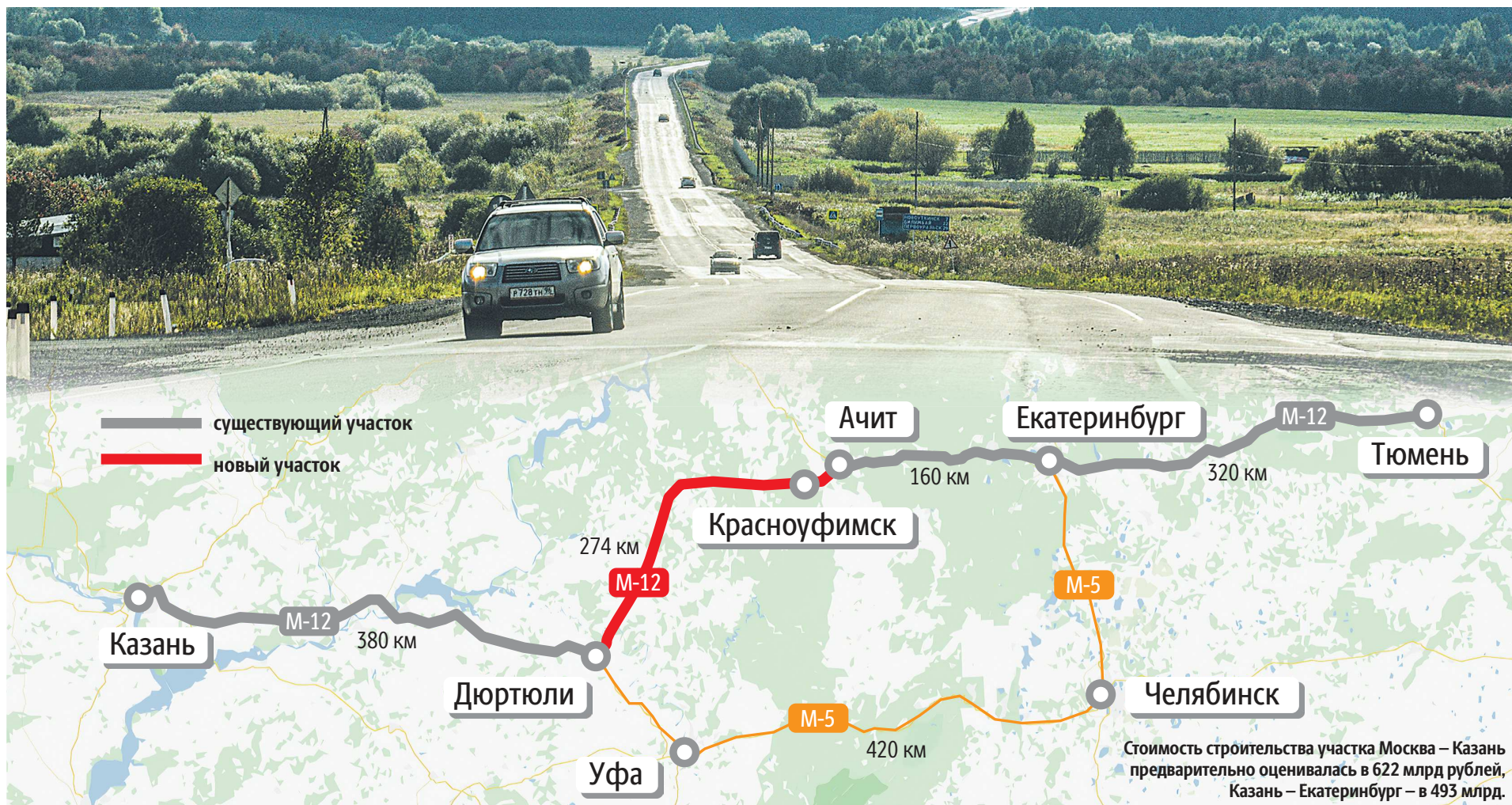
Стоимость строительства участка Москва – Казань предварительно оценивалась в 622 млрд рублей, Казань – Екатеринбург – в 493 млрд.