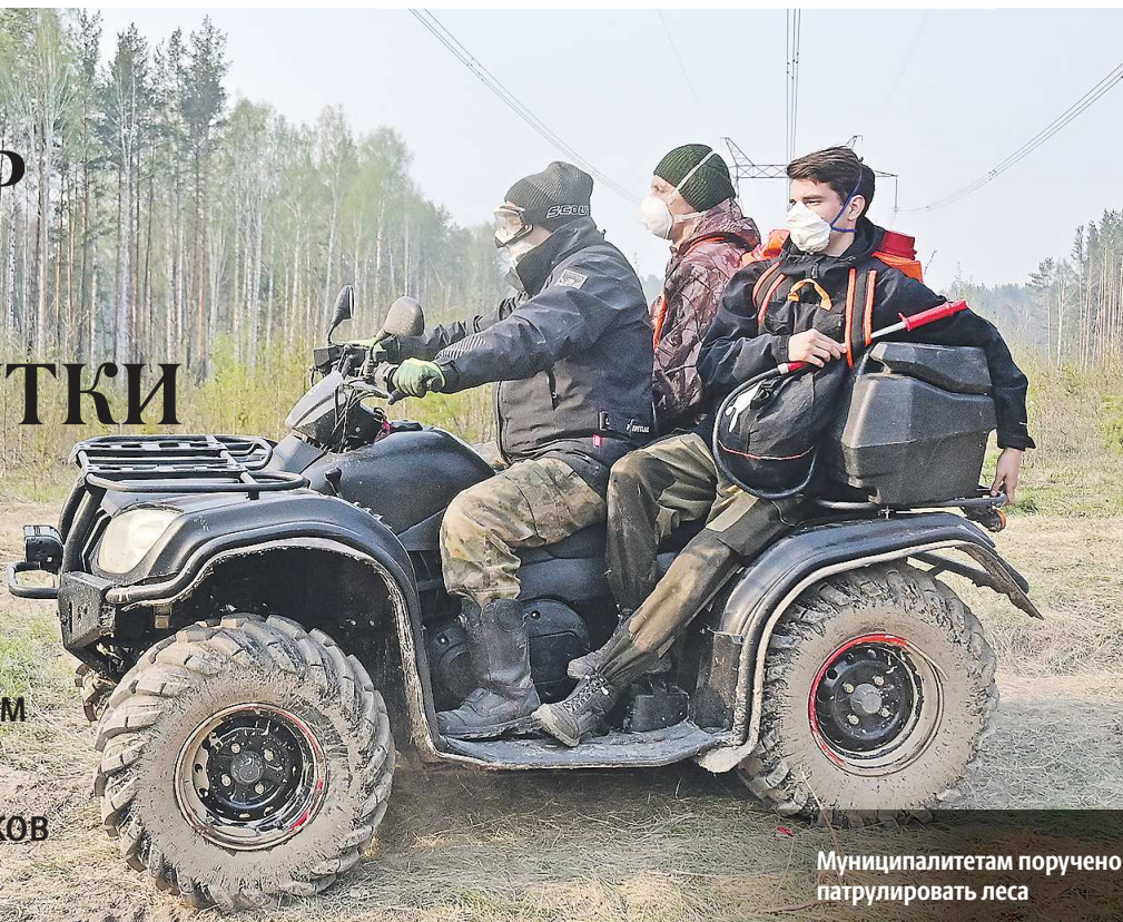
Муниципалитетам поручено патрулировать леса

Губернатор дал новые вводные по противодействию пожарам муниципальным штабам и арендаторам лесных участков