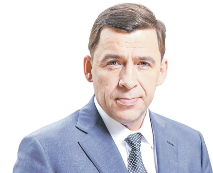
Евгений КУЙВАШЕВ, губернатор Свердловской области

В послании Федеральному Собранию в апреле 2021 года