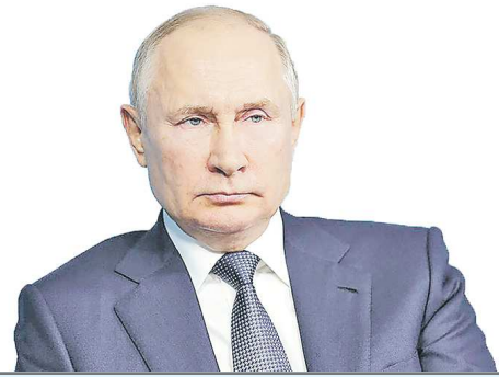
Владимир ПУТИН, Президент России

“ Выделим средства из Фонда национального благосостояния на опорные магистрали. Прежде всего нужно форсировать уже идущее строительство скоростной автомагистрали Москва – Казань и, более того, продлить ее до Екатеринбурга, завершить этот проект за три года. Таким образом, в 2024 году с учетом действующей трассы Москва – Санкт-Петербург и Центральной кольцевой автодороги будет обеспечено безопасное скоростное движение автотранспорта через всю европейскую часть от Балтики до Урала.