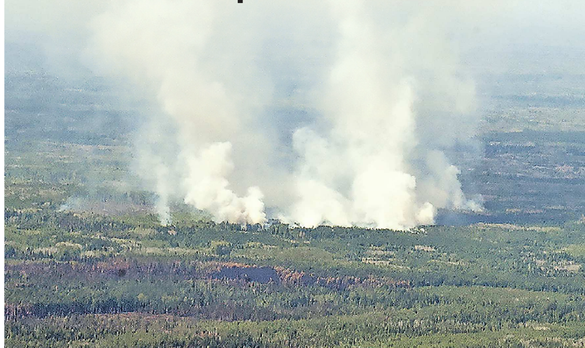
ПОЛИНА ЗИНОВЬЕВА / БОРИС ЯРКОВ

Противодействие Ответственность. Оперативность