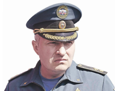
Александр КУРЕНКОВ, министр РФ по делам гражданской обороны, чрезвычайным ситуациям и ликвидации последствий стихийных бедствий

“ На сегодняшний день Свердловская область является одним из самых подверженных горению субъектов Российской Федерации. Из-за лесных пожаров шесть муниципальных образований, включая Екатеринбург, оказались в зоне задымления. Фиксировались незначительные превышения пределов допустимой концентрации вредных веществ в атмосфере.