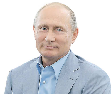
Владимир ПУТИН, Президент России

“ Успех страны, как известно, складывается из труда, достижений людей, объединенных общими ценностями, культурой, традициями, уважением к истории и стремлением внести свой вклад в развитие России, людей, не на словах, а на деле вовлеченных в то, что происходит в их городе, поселке, государстве в целом.