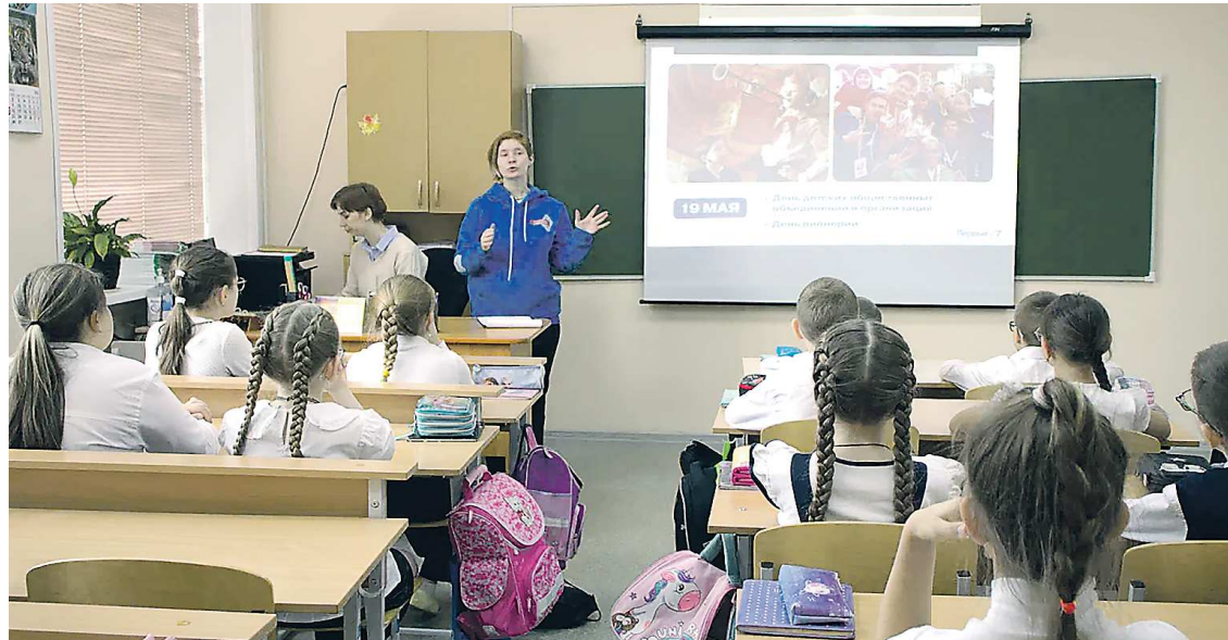
На открытом уроке школьники узнали о том, какие проекты будут реализованы в этом году под эгидой «Движение первых»

Корреспонденты открытого урока познакомили школьников с проектами «Движения пер-