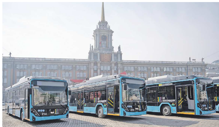
Новые троллейбусы вышли на самые востребованные городские маршруты сразу после церемонии

Как рассказали на «Белкоммунмаше» информационному