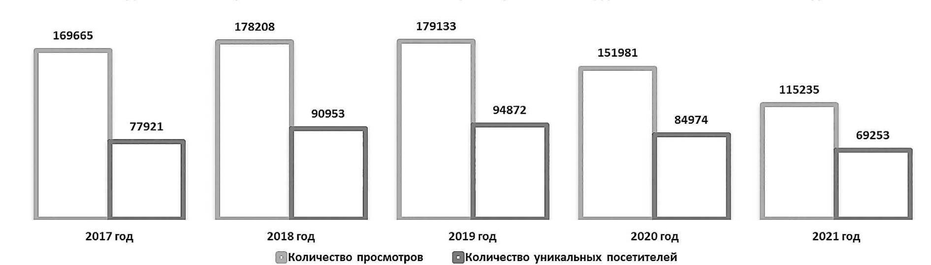
Рис.12. Годовая динамика посещения сайта в 2017-2021 гг.