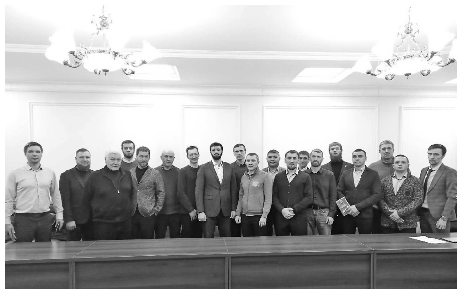
Фото 8. Учредительное собрание Совета отцов Свердловской области

В нем приняли участие отцы из Екатеринбурга, Богдановича, Заречного, Режа, Ревды, Невьянска, Кировграда, Нижнего Тагила, Свободного, Серова и Верхотурья. Мероприятие прошло в конференц-зале Уральского государственного горного университета. Большая часть представителей муниципалитетов области присутствовала в формате видеоконференцсвязи. В дальнейшем, после регистрации Движения в Минюсте России, будет зарегистрировано и Свердловское региональное отделение, в котором были выбраны органы управления организации: Правление, Председатель правления. Члены ревизионной комиссии и Председатель ревизионной комиссии. Все решения, в том числе и адрес местонахождения юридического лица, и собственно само решение о создании регионального отделения Движения в Свердловской области, приняты единогласно.