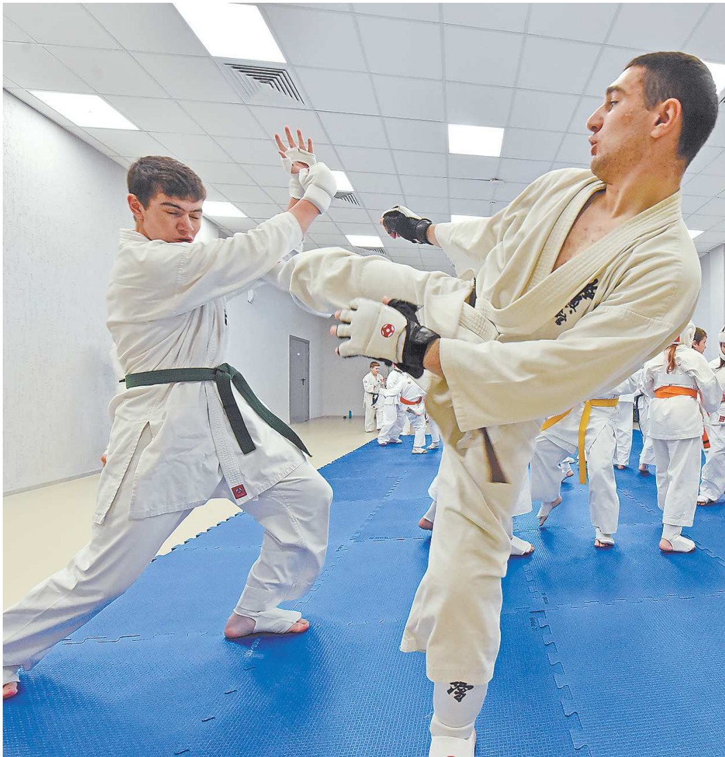
Каратисты уже начали свои тренировки в новом зале

На втором этаже располагается главный большой зал. Здесь – три самбистских ковра для проведения соревнований, а также трибуны вместимостью на тысячу зрителей. На открытие пришли как юные спортсмены, так и те, кто прославляют регион, и в частности Верхнюю Пышму, на международных соревнованиях. Ни для кого не секрет, что пышинская школа самбо является одной из лучших не только в стране, но и в мире. Спортсмены клуба «УГМК» регулярно становятся победителями и призерами чемпионатов страны и представляют национальную сборную на чемпионатах Европы и мира.