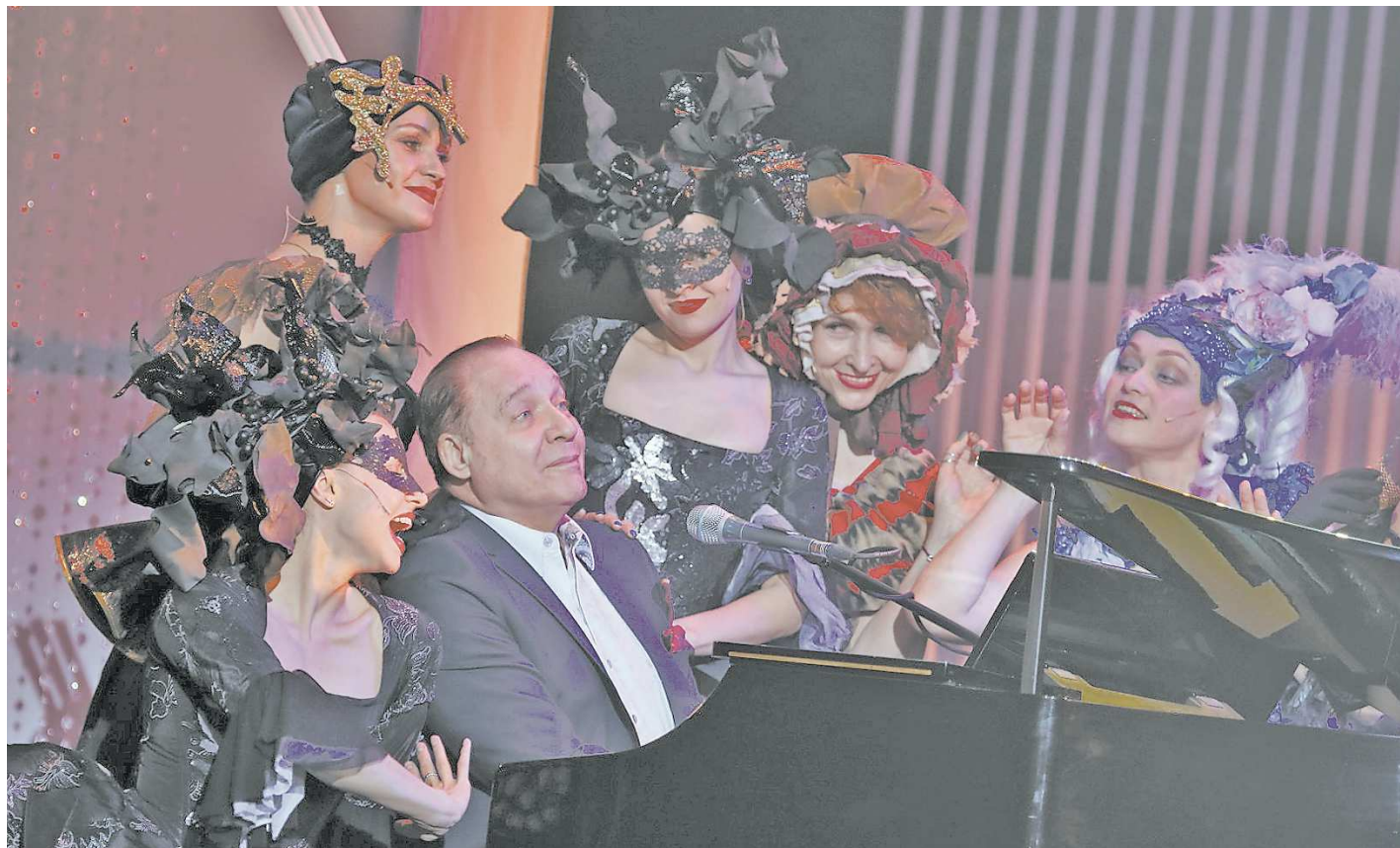
Когда председатель жюри конкурса — автор любимых мюзиклов и песенных хитов Максим Дунаевский, то церемония награждения лауреатов превращается в Театр, а вместе с артистами на сцене поет весь зал

Так и было. Даже во время конкурсных прослушиваний. Немного зрители, кому удалось так проникнуть в зал, на отдельных выступлениях не могли сдержать эмоций, начинали аплодировать с галерки. Членам жюри приходилось оборачиваться и выразительными взглядами