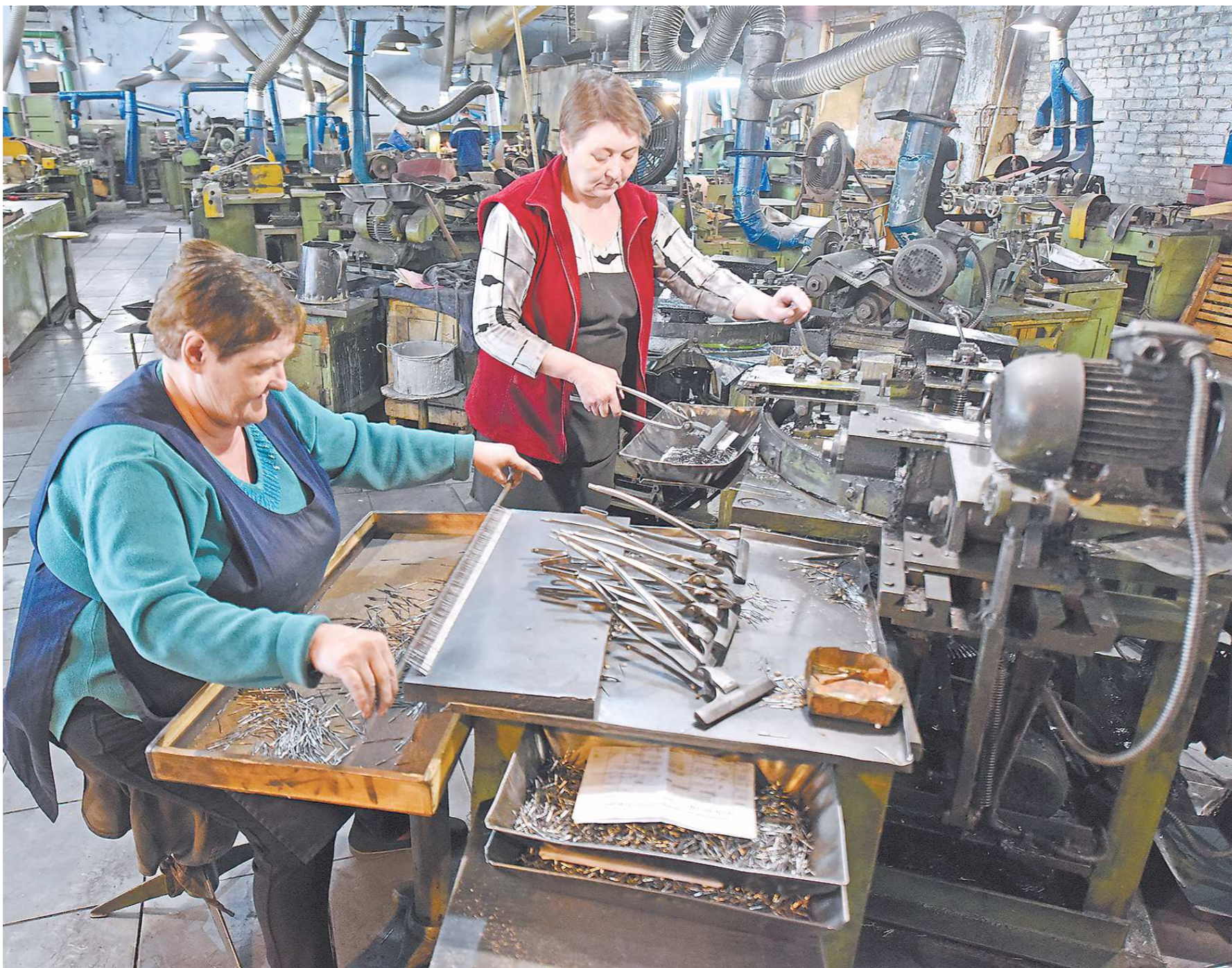
На Артинском заводе большинство работников – женщины. Вручную и на станках они обрабатывают заготовки под будущие иглы

Одним из предприятий, уже получивших помощь областных властей, стал завод по производству игл, вазальных спиц и шильев в Артях.