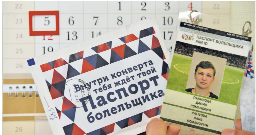
Вот так выглядел паспорт болельщика в 2017 году во время матчей Кубка Конфедераций

Встреча за Суперкубок запланирована на 9 или 10 июля, а