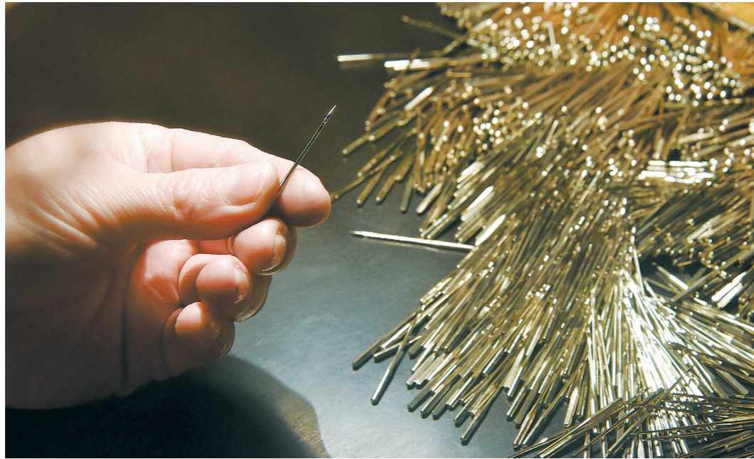
Ассортимент свердловских игл очень большой: для кожи, джинсы, трикотажа, стрейча, универсальных, пуговичных и оверлок-машин

Игольное производство в поселке Арты существует уже 80 лет. До 2011 года оно считалось структурным подразделением Артинского металлургического завода, а потом стало самостоятельным юридическим лицом - ООО «Акционер Артинского завода».