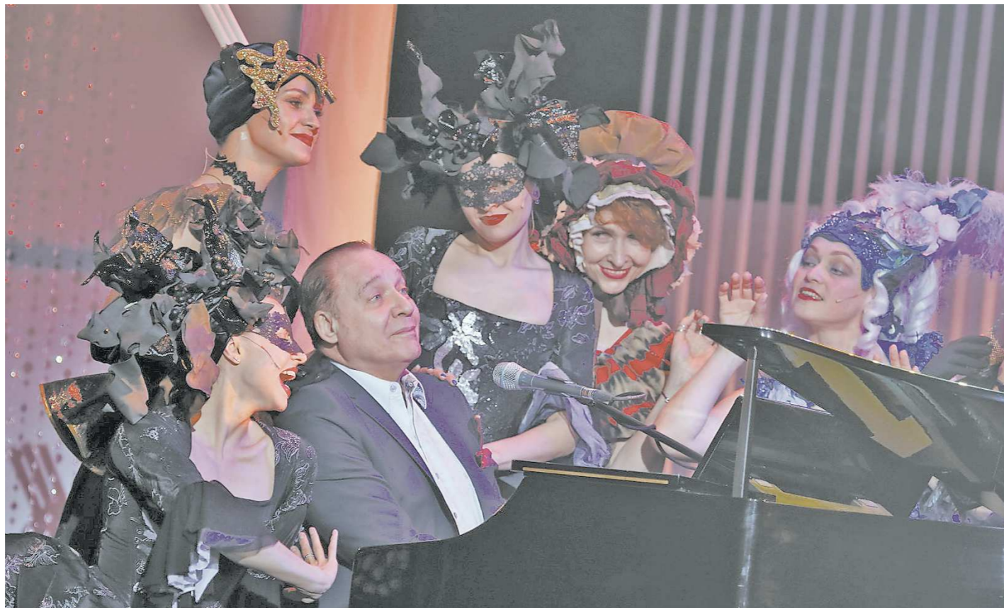
Когда председатель жюри конкурса — автор любимых мюзиклов и песенных хитов Максим Дунаевский, то церемония награждения лауреатов превращается в Театр, а вместе с артистами на сцене поет весь зал

Так и было. Даже во время конкурсных прослушиваний. Немного зрители, кому удалось так проникнуть в зал, на отдельных выступлениях не могли сдержать эмоций, начинали аплодировать с галерки. Членам жюри приходилось оборачиваться и выразительными взглядами