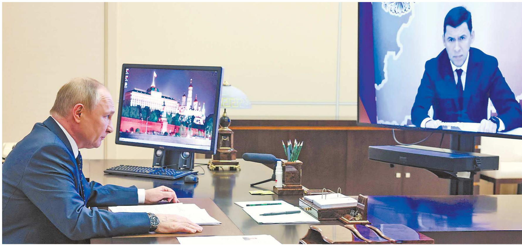
Евгений Куйвашев встретился с президентом страны в формате видеоконференции

Еще одно обращение касалось обновления троллейбусного парка к 300-летию Екатеринбурга. Речь идет о закупке троллейбусов с удлиненным автономным ходом на сумму в 3,5 миллиарда рублей. Этот вопрос будет проработан регионом совместно с Минтрансом России.