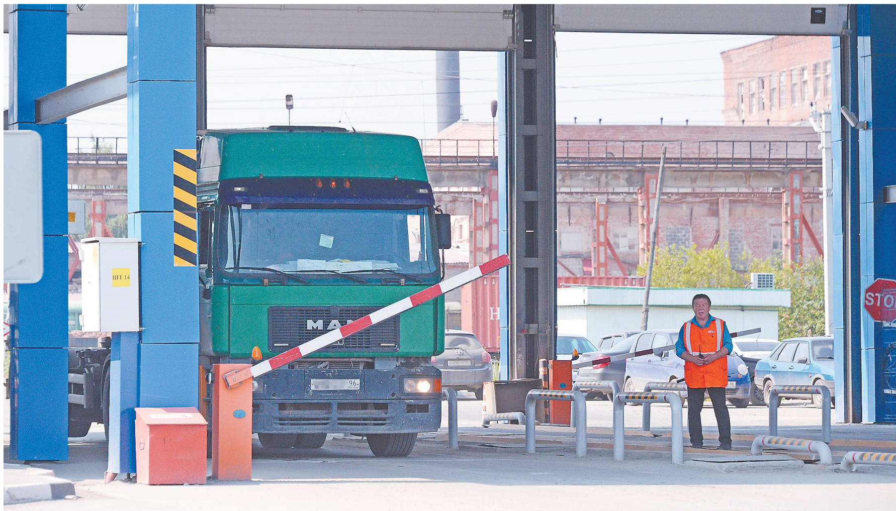
Российские грузоперевозчики требуют закрыть границу для европейских коллег

Екатеринбургская компания «Лорри», которая входит в группу компаний Globaltruck – ведущего FTL перевозчика России, в числе прочего возит европейским покупателям Airbus и Boeing продукцию из титана корпорации ВСМПО-Ависма. Точнее, возила. Сейчас на погра-