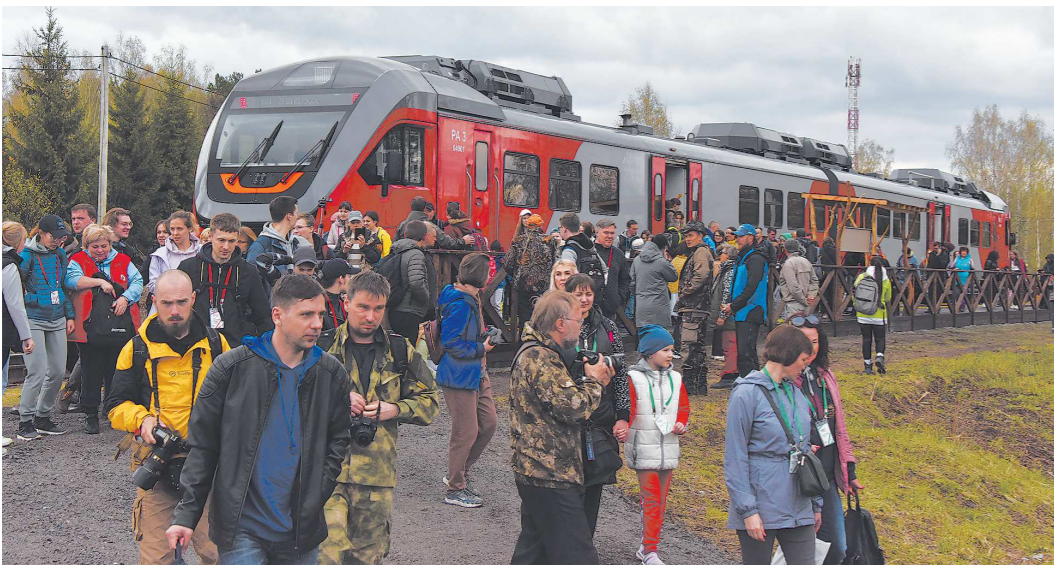
Добраться из Екатеринбурга до «Оленьих ручьев» на рельсовом автобусе можно за 2 часа 37 минут

Это самый маленький, но самый посещаемый природный парк Среднего Урала. В прошлом году там побывали 130 тысяч туристов. Суточный рекорд – более 4 700 посетителей. 2022-й – не исключение, в парке ожидают новых рекордов. Теперь до «Оленьих ручьев» стал курсировать пригородный поезд. Корреспондент «ОГ» Сергей ХАНДЮКОВ сходил в поход.