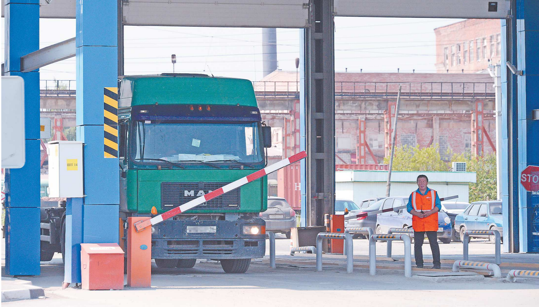
Российские грузоперевозчики требуют закрыть границу для европейских коллег

Екатеринбургская компания «Лорри», которая входит в группу компаний Globaltruck – ведущего FTL перевозчика России, в числе прочего возит европейским покупателям Airbus и Boeing продукцию из титана корпорации ВСМПО-Ависма. Точнее, возила. Сейчас на погра-