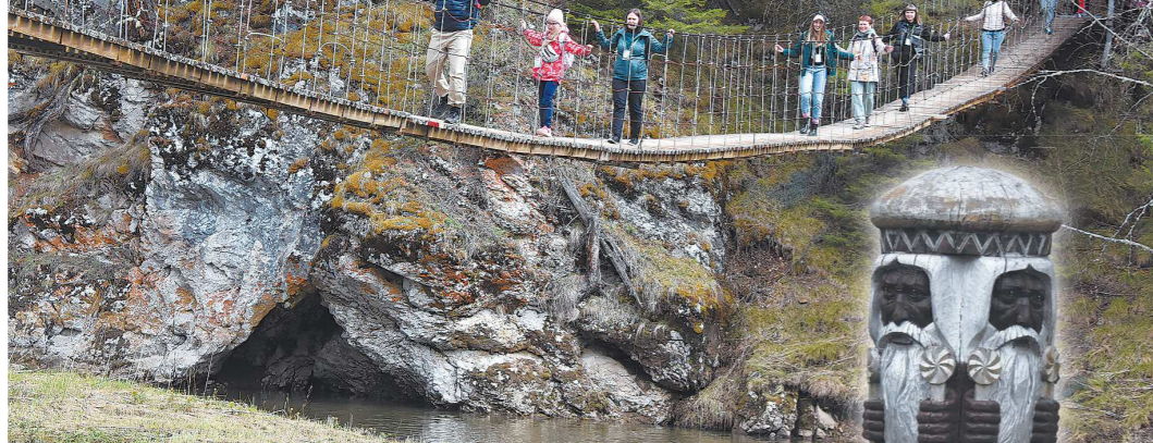
Даже пройти по подвесному мосту – занятие более чем увлекательное