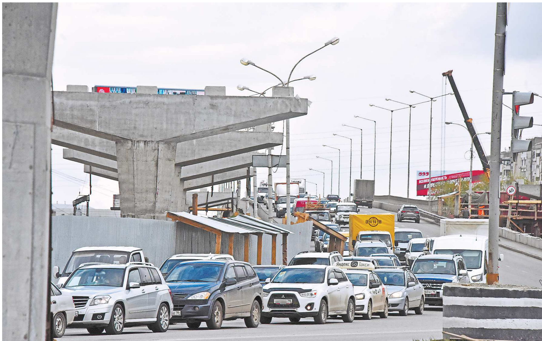
Уже на днях рабочие начнут укладывать пролетные балки на путепроводе у концерна «Калина»

Сейчас завершается подготовка необходимой документации, строители ведут вырубку леса. Об этом вчера на пресс-конференции сооб-