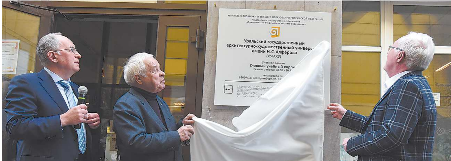
Арх меняет свое название уже в третий раз

В 2022 году Уральский государственный архитектурно-художественный университет отмечает сразу три юбилея: 75-летие высшему архитектурному образованию на Урале, 55 лет со дня основания Уральского филиала МАИ и 50 лет со дня образования УрГАХУ.