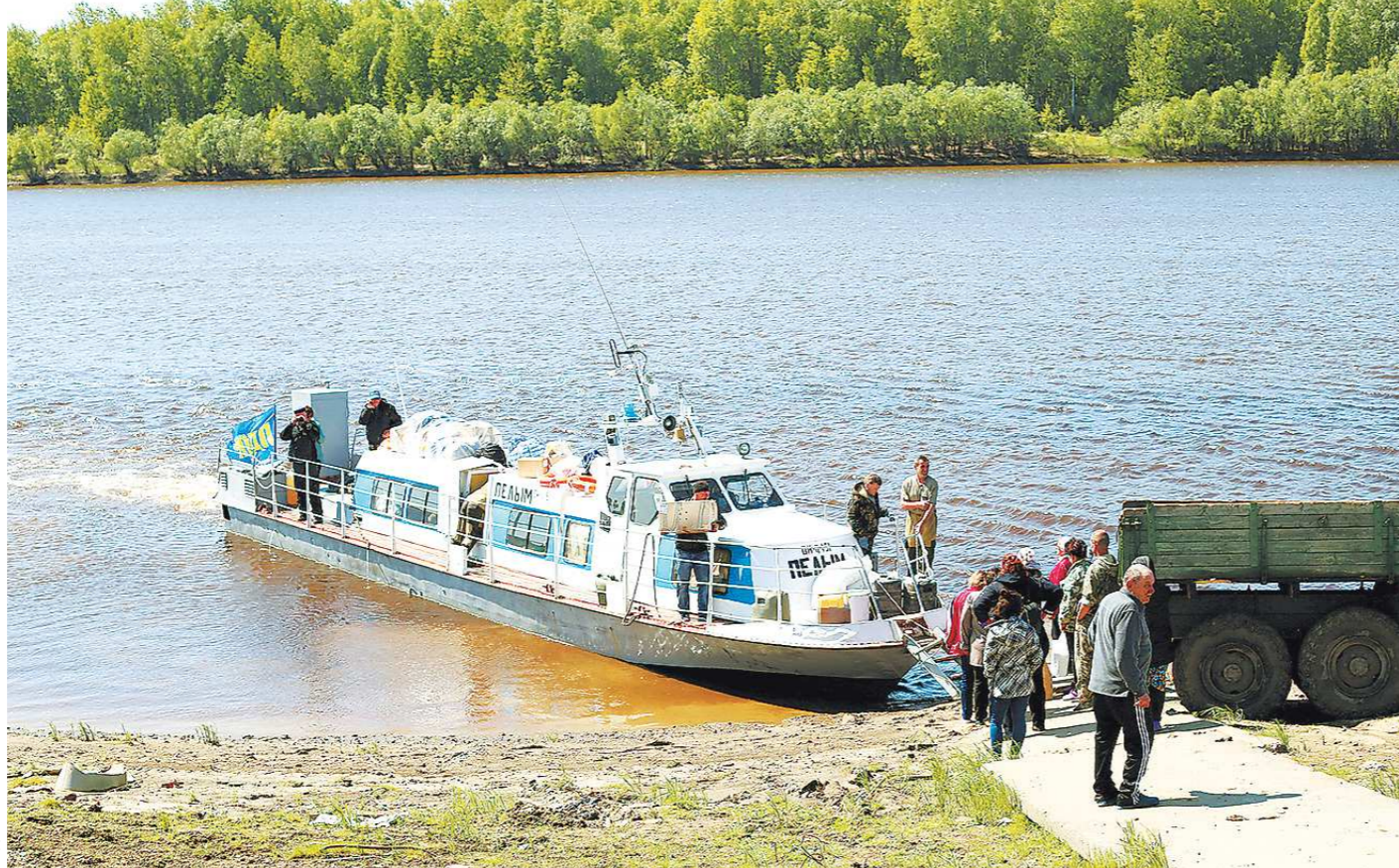
Катер «Пельм» доставил груз жителям Пуксинки

С 2002 года «Пристань Гари» – муниципальное предприятие. Оно получает дотацию из местного бюджета на транспортные перевозки (в среднем выходит по 5,5 млн рублей в год). Плюс зарабатывает самостоятельно, принимая частные заказы. Но расходы все равно