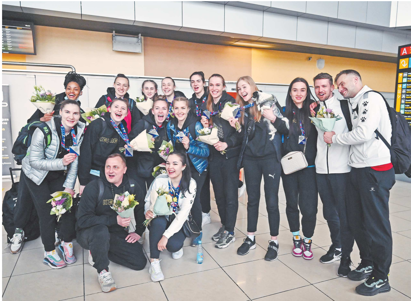
«Уралочка-НТМК» с серебряными медалями чемпионата России и подарками от болельщиков

Но при всем этом «Уралочка» в плей-офф была совершенно другой командой. Ка-