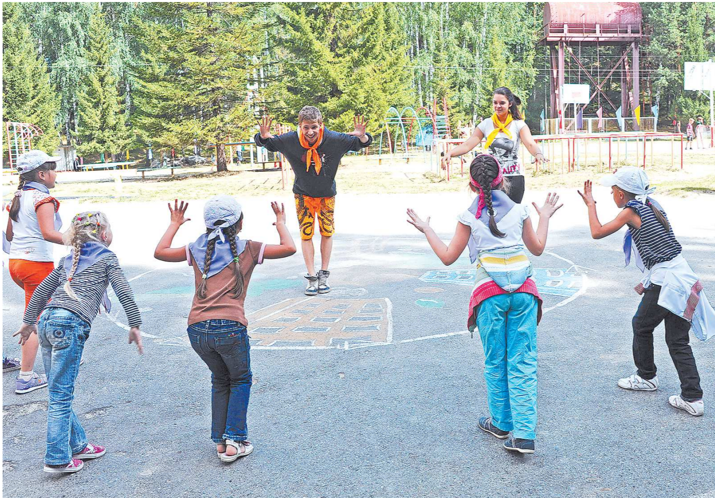
В этом году летняя оздоровительная кампания охватит 440 955 детей, из них только 16,4 процента поедут в загородные детские лагеря

Сегодня во многих уральских муниципалитетах идет реконструкция корпусов, столовых, клубов в загородных детских лагерях. Так, в Асбесте приступают к капитальному