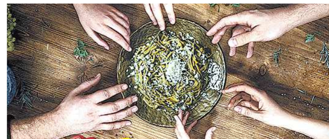
Черемша — 1 кг, топленое масло — 100 г.