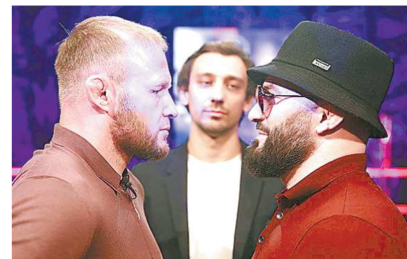
Александр Шлеменко (слева) и Магомед Исмаилов провели дуэль взглядов

Известные российские бойцы Александр ШЛЕМЕНКО и Магомед ИСМАИЛОВ проведут поединок в Екатеринбурге. Сегодня спортсмены подписали контракт на бой, который состоится в августе на турнире RCC 12.