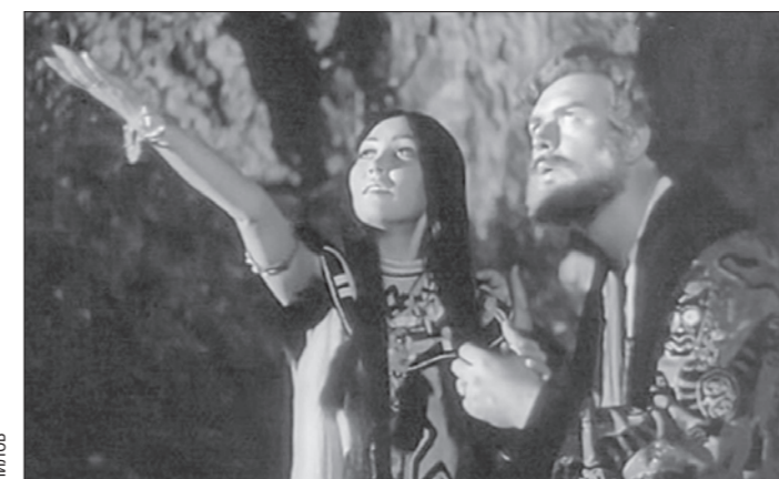
ЮРИЙ ИЗ ХИФ «УТРОМ РИКА» (1988 г.), РЕЖ. Я. ЛАШИН

Этот год объявлен в Свердловской области Годом ДМИТРИЯ МАМИНА-СИБИРЯКА . Писатель и драматург родился в посёлке Висим на севере региона. Первый крупный роман «Приваловские миллионы» был экранизирован