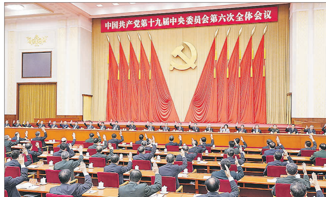
В работе Шестого пленума приняли участие 400 членов и кандидатов в члены Центрального комитета Компартии Китая во главе с её Генеральным секретарём Си Цзиньпином

бя все классические элементы: право избирать и быть избранным, социальное равенство, свободное волеизъявление широких масс и отдельных групп граждан. Эти механизмы охватывают весь процесс демократической политики – выборы, консультации, принятие решений, народное управление и контроль за властью.