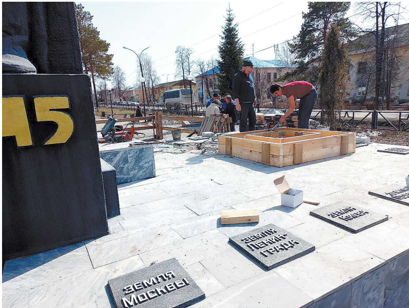
Установкой Вечного огня в центральном городском сквере Артемовского занимаются с конца марта. На днях звезда уже заняла свое место на постаменте, сейчас идут пусконаладочные работы

Он был очень удивлен, почему именно к ним мы об-