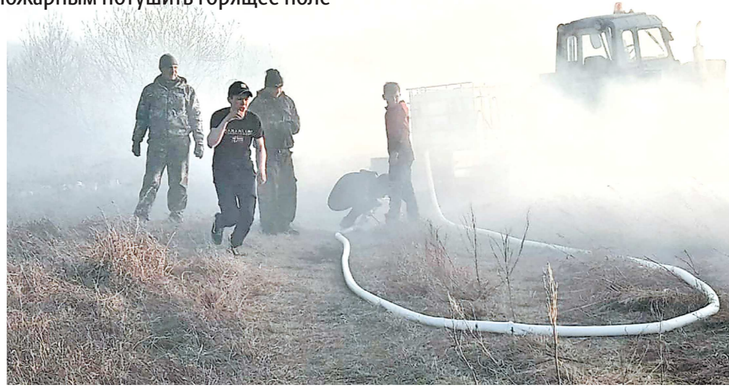
Школьники разобрали свободные ранцевые огнетушители и помогли взрослым, пока пожар не был потушен

– Мостовская дружина – одна из самых активных. Они помогают защищать не только свое село, но и другие территории, – пояснила заместитель председателя совета