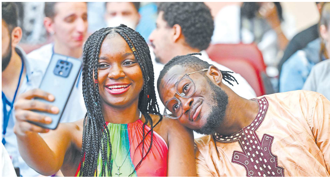
В свердловских вузах учатся студенты из нескольких десятков стран

Также посол предложил уделить больше внимания партнерским программам, в рамках которых иностранных студентов могли бы встречать в аэропорту, на вокзале, помочь оформить необходимые документы