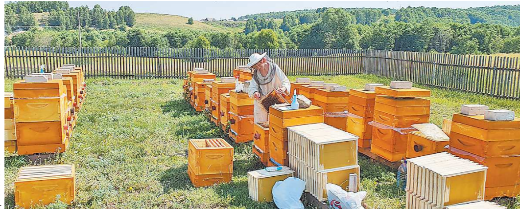
Маркировка пчел, как считают пасечники, не только абсурдна, но и затратна. В некоторых хозяйствах сотни пчелосемей, и для каждой нужно выкупить бирку

Поправки к закону «О ветеринарии», вводящие правила маркировки и учета животных, приняты Госдумой в первом чтении. Опасения многих владельцев кошек и собак не оправдались: их питомцев пока чипировать не будут. А вот коровы, лошади, свиньи и даже пчелы с рыбами подлежат маркировке. Принять закон планируют к осени этого года.